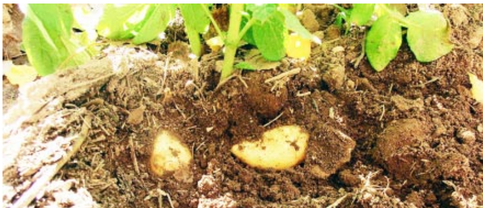
El trabajo ya fue publicado en "The Plant Journal" y la Agencia CyTA del Instituto Leloir.

La investigación de la UBA y el Conicet logra un 17% más de rendimientos de las plantas de papas en condiciones de estrés. Los resultados realizados en un invernadero, sientan bases para aumentar los rendimientos de papa en condiciones de recursos limitantes, como la disponibilidad de agua en el suelo.