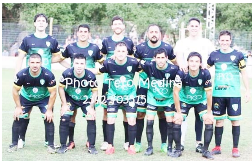
Porteño, club más antiguo de la Liga, volvió a la competencia este año.