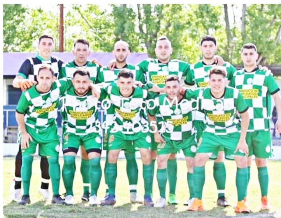
SEMB, es la sigla del Sindicato de Empleados Municipales.