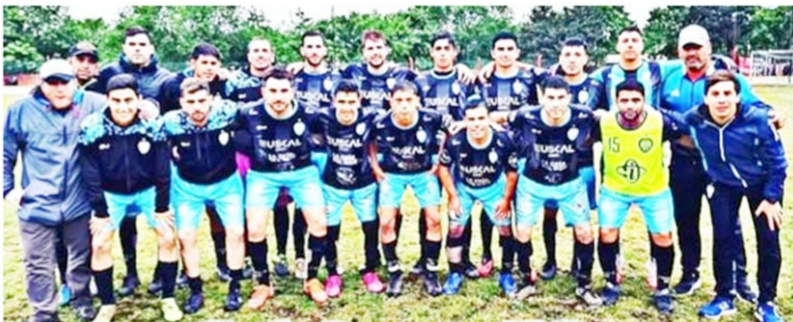
Salaberry tiene historia y en la actualidad no hace sino justificarla.

-Desde las 19.15 horas, los protagonistas serán Bragado Club vs. SEMB (Sindicato de Municipales). El arbitraje estará a cargo de Pröenca y Mario Palavecino, respectivamente.