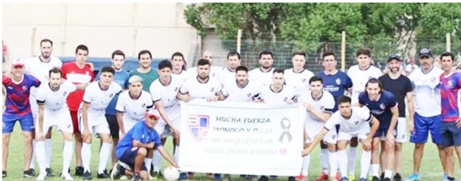
Bragado Club campeón de las últimas 5 ediciones del torneo local.