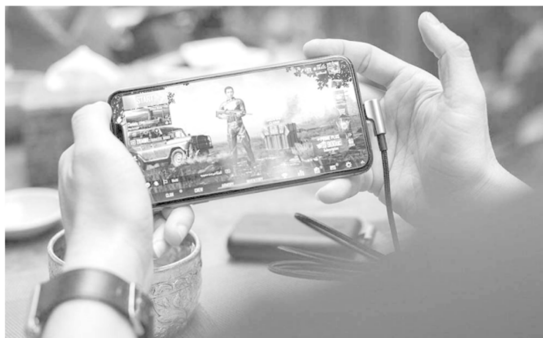
Adicción a los videojuegos. La OMS la reconoció como una nueva enfermedad en su manual de patologías 2022.

respuesta a la tendencia que se venía registrando respecto a las consecuencias que puede generar la hiperconectividad, situación que se vio potenciada producto de los aislamientos y distanciamientos provocados por la pandemia en todo el mundo", afirmó el defen-