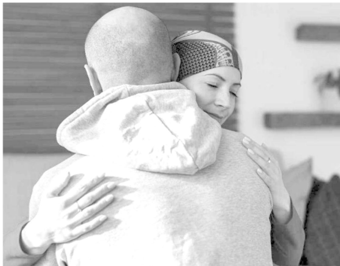
Oncología. Es importante considerar la sexualidad como parte del cuidado de la calidad de vida del paciente.

Es importante considerar la sexualidad como parte del cuidado de la calidad de vida del paciente.