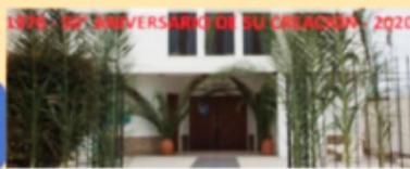
Parroquia San Martín de Porres de Bragado