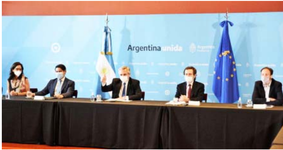
El momento de la firma del préstamo para obras en el Río Salado por parte del presidente

El Gobierno de la Provincia obtendrá un préstamo internacional para destinar a las obras de la cuenca del Río Salado. Los detalles.