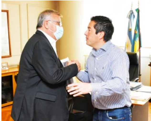
estructura Federal, que tiene que ver con cordón cuneta, pavimento y luces LED. (Gacetilla)

También se habló sobre las obras que están en ejecución: las cloacas en O'Brien y el gas en Comodoro Py y las que corresponden el Fondo de Infra-