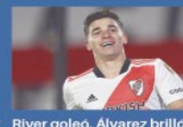
River goleó, Alvarez brilló

▶ Acto por el 25 de mayo: el Presidente dio otra señal de tregua