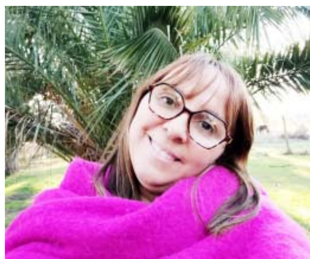
La dirigió José María Muscari, con quien hizo temporada en Mar del Plata.