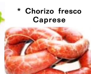
* Chorizo fresco Caprese