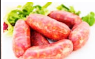
* Chorizo fresco Sin Sal