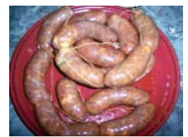
* Chorizo fresco Con queso azul

LA CASITA UN LUGAR DE CONFIANZA Te. 427649 - Rivadavia 2222