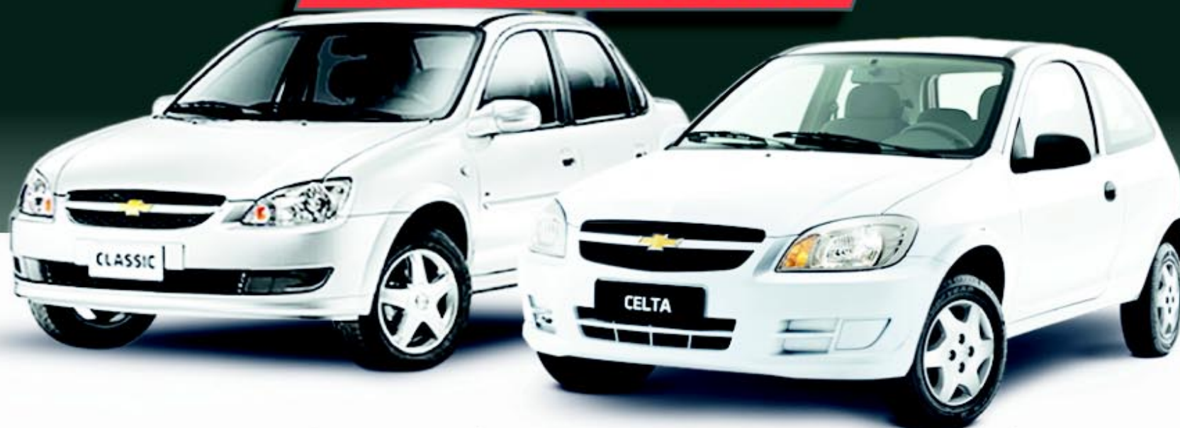
CLASSIC / 2013 A 2017