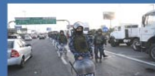
▶ Gasoil: sigue la protesta

▶ Hallan fotos de misiles y banderas contra Israel en el celular del piloto