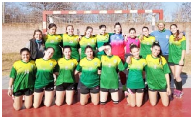
Primera Caballeros Porteño 10 - C.A.I. 20

Mini Mixto Porteño 1 - C.A.I. 3 Cadetes Caballeros Porteño 12 - C.A.I. 36 Juveniles Caballeros Porteño 16 - C.A.I. 30