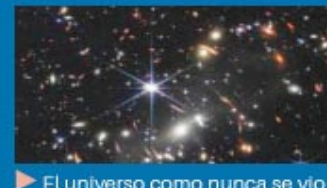
► El universo como nunca se vio

► Piden investigar de manera conjunta las causas contra Cristina