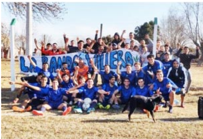
En la imagen el equipo de Villa luego de la victoria y clasificación a la final del ascenso festejando con su gente

ya tiene un lugar en la final del Ascenso, que se jugará a dos partidos, el primero será el domingo a las 16 horas, en Bragado y se enfrentarán a Los Ponis de