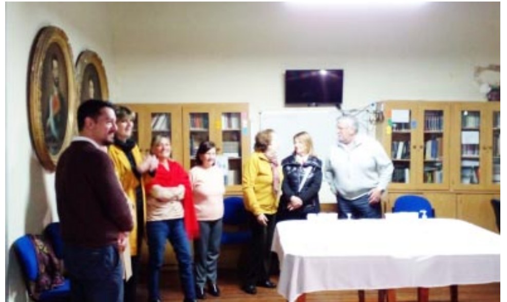
que la conforman, queremos mantener viva la cultura, la