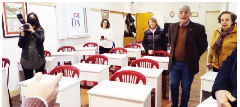
Dante brindó un lunch a los presentes.