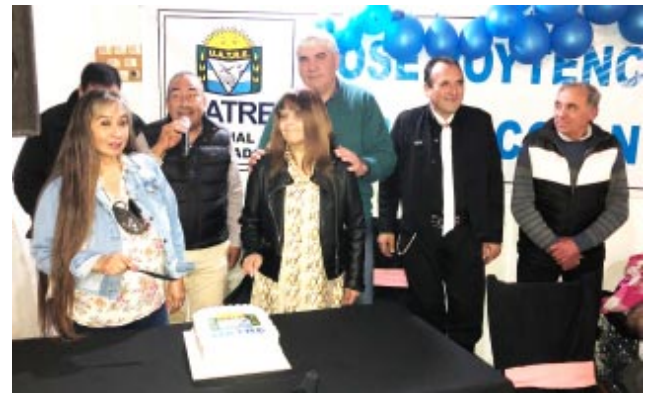
Momento simbólico del corte de la tora por parte de los miembros de la comisión de UATRE.