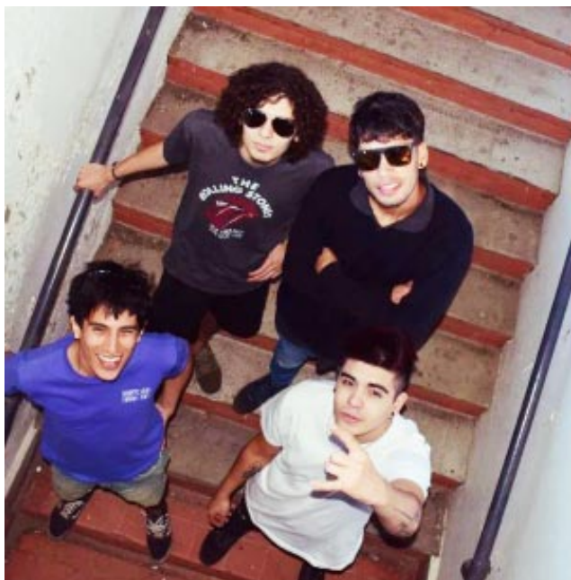
La banda tributo a Callejeros “Los Invisibles” se presentará en Bragado el próximo sábado, junto a

-Dialogamos con las dos bandas invitadas