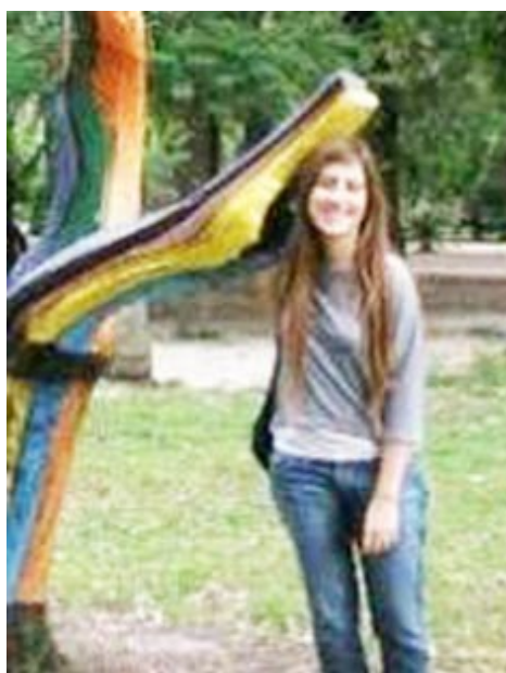
UN ENCUENTRO POR LOS CHICOS CON SENTIDO COMUNITARIO

Durante mucho tiempo se ha denotado el sentido del juego, en tal sentido desde la sociedad muchas veces se lo utiliza en frases que buscan desdibujar el verdadero fin que este tiene. "Dejá de jugar y ponete a trabajar" es una frase que todos hemos escuchado y que en realidad ataca el sentido creativo, constructivo y socializante que el juego nos brinda como comunidad. Atacar el juego, es atacar a nuestra infancia. Es por eso que varias organizaciones sociales, profesionales y vecinos, han tomado muy seriamente el juego, como una forma de reconstruir los tejidos sociales dañados y de garantizar, desde una mirada comunitaria, los derechos de nuestros chicos.