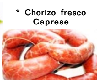
* Chorizo fresco Caprese