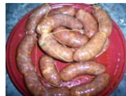
* Chorizo fresco Con queso azul

LA CASITA UN LUGAR DE CONFIANZA Te. 427649 - Rivadavia 2222