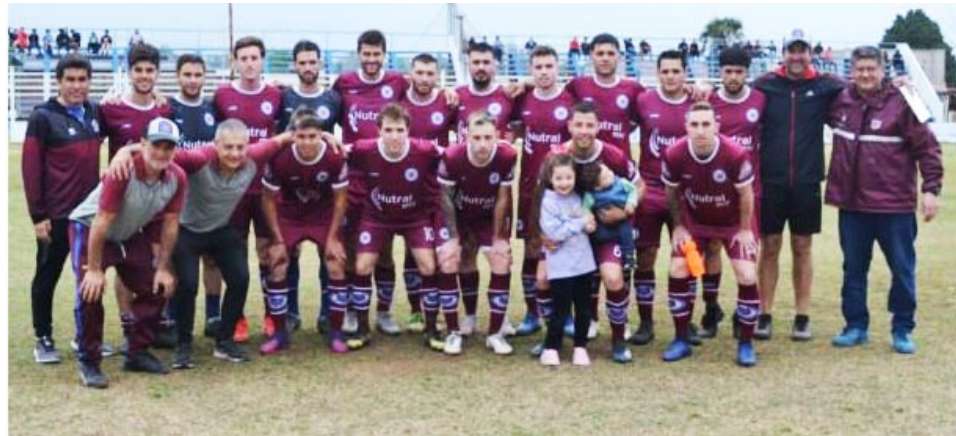
Equipo de San Agustín que el domingo igualó con San Martín.