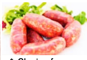
* Chorizo fresco Sin Sal