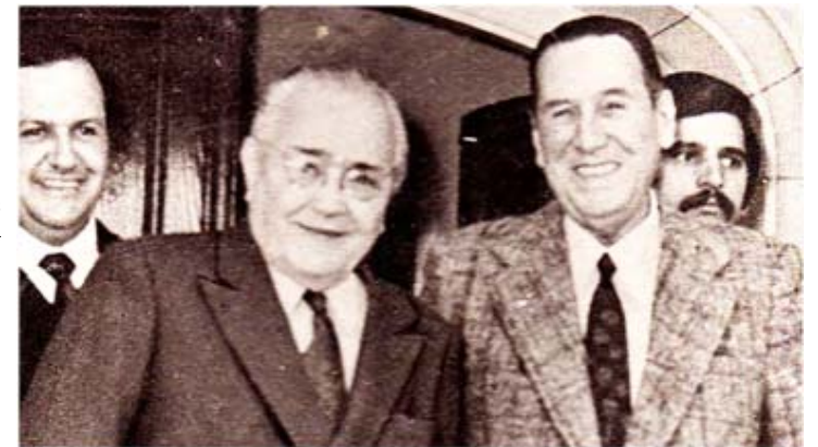
Foto de líderes sociales (Balbín - Perón, que se amigaron tardíamente.