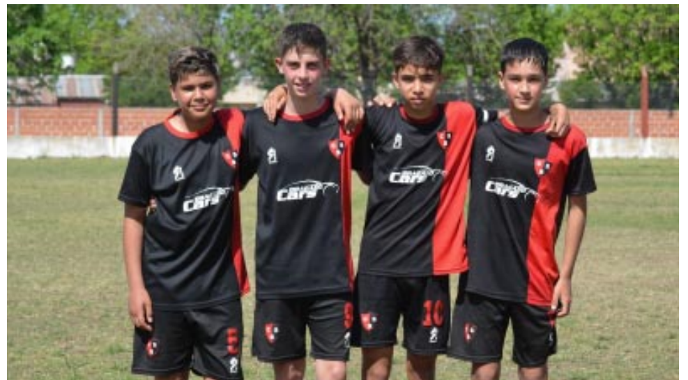
Los autores de los goles de la 2009 Muñoz, Tello, Michel y Ramírez.

marcarse diferencias igualando por un gol para cada conjunto.