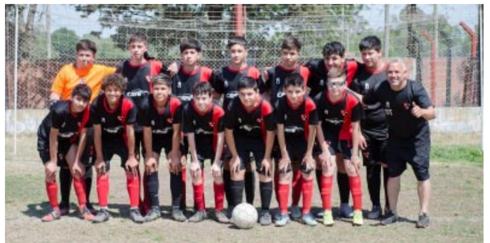
Sportivo categoría 2009

correspondía a la categoría 2007, donde nuevamente Sportivo se alzaría con el triunfo, en esta oportunidad por la mínima diferencia de un gol contra cero.