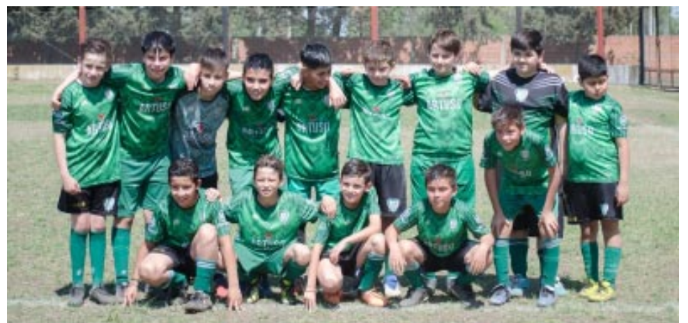
El Verde Fútbol categoría 2011