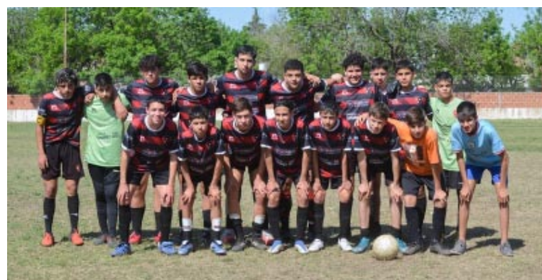
Sportivo categoría 2007