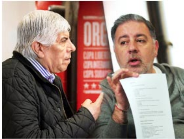
La dirigencia en proceso de cambio: Antes y ahora.

"La feliz" es una ciudad hermosa todo el año. Un lugar que se elegiría para vivir al menos durante unos días. Los Juegos tienen la virtud de unir a los chicos con los abuelos, algo necesario para la convivencia.