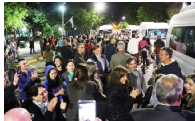
Foto panorámica de la llegada de la delegación en la noche del jueves.