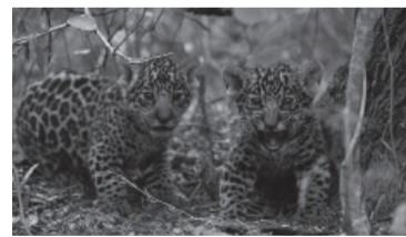
Cachorros de yagareté.

Según detalló la Fundación, días atrás se completó una ambiciosa acción de conservación activa iniciada en marzo de este año, cuando la yagareté correntina Mbarete fue llevada temporalmente al Parque Nacional El Impenetrable, ubicado en la provincia