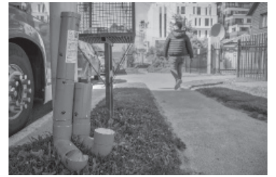
Comedores para perros.