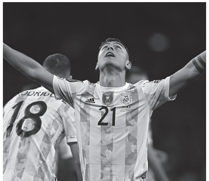
Nueva oportunidad. A los 28, la "Joya" tendrá su gran chance con una camiseta Argentina en la que todavía no brilló. - Télam -

drá su revancha después de perderse la Copa América del año pasado, donde cayó en la consideración del entrenador luego de errores cometidos en partidos con Chile y Colombia por las Eliminatorias Sudamericanas.