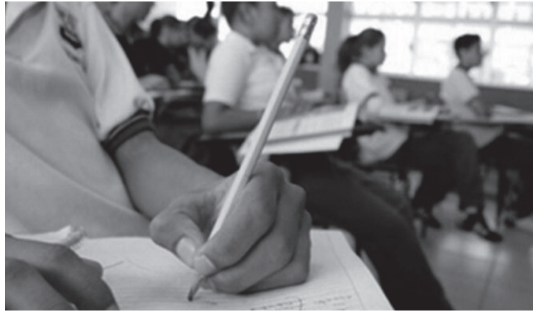
Problemática. Tres de cada 10 familias enfrentan algún tipo de deuda en las cuotas. - DIB -

El relevamiento determina, además, que el 60% de los establecimientos educativos no estatales tienen retrasos en los pagos