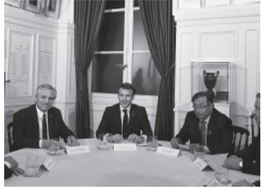
Los mandatarios mantienen ejes en común.