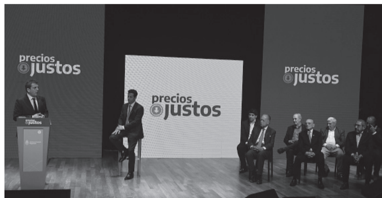
Acuerdo. Massa y Tombolini junto a empresarios.

Para corroborar el cumplimiento de los acuerdos, la Secretaría de Comercio firmará convenios con cada municipio del país que pretenda colaborar. De esa manera, se asegura tener mayor capilaridad para hacer el seguimiento de precios y "amplía la dotación de fiscalizadores" en todo el país. La Secretaría de Comercio ideó una especie de contrato con los municipios para que sean ellos los