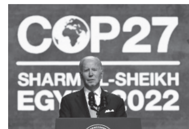
Biden pidió perdón por la salida del Acuerdo de París.