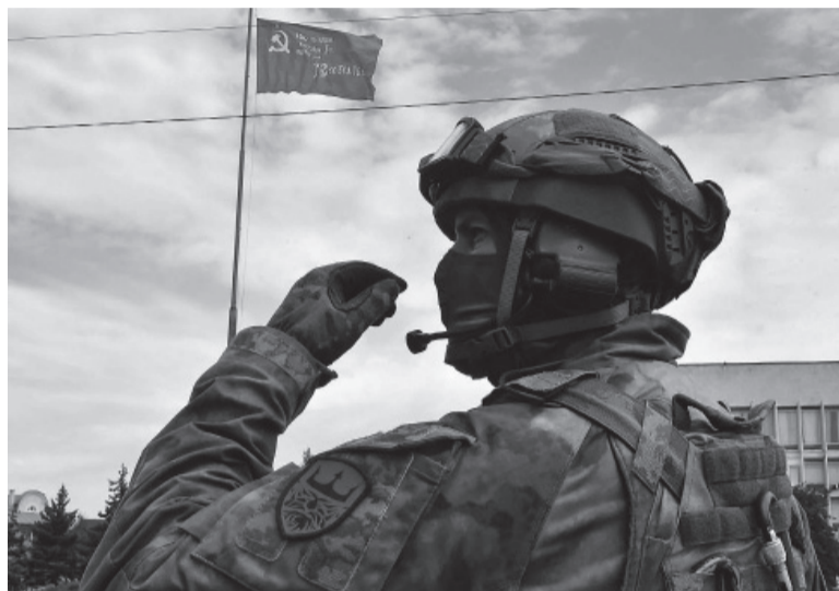
Operativo. La ciudad estuvo tomada casi nueve meses.

Zelenski elogió la valentía de los habitantes de Jerson, ocupada desde mediados de marzo y anexa-