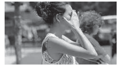
Altas temperaturas.