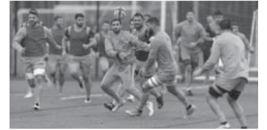
Será el tercer y último partido de la gira por Gran Bretaña. - Los Pumas -