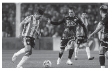
A "La Gloria" le sirve el empate porque tiene ventaja deportiva. - Internet -

El más perjudicado resultó Canapino, quien terminó en el puesto 46. Por su parte, Werner clasificó 41 y Urcera 39. El mejor posicionado de los que pelean por el título fue Germán Todino, con el casillero 33. - DIB -