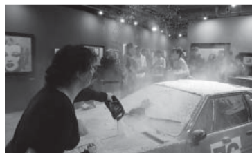
Activista ecológica en acción.

Según datos de la Organización Mundial de la Salud (OMS), una de cada 5 mujeres y uno de cada 13 varones declaran haber sufrido abusos sexuales en la infancia. - Télam -