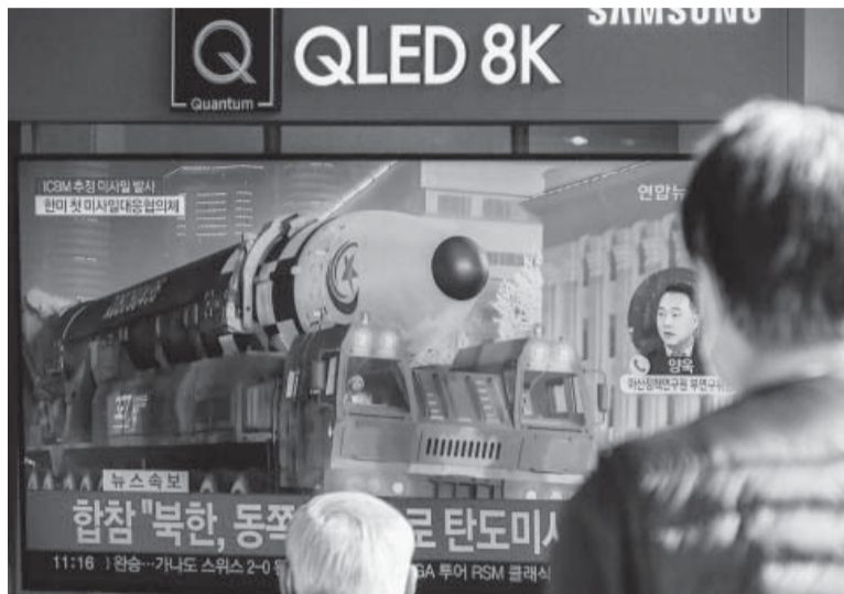
Ensayo. Corea del Norte intensifica disparos y mensajes.

“Condenamos firmemente estas acciones y reiteramos el llamado para que Corea del Norte cese estos actos ilegales y desestabilizadores”, dijo Harris a los periodistas antes del inicio de la reunión. “En nombre de Estados Unidos, reafirmo nuestro férreo compromiso con nuestras