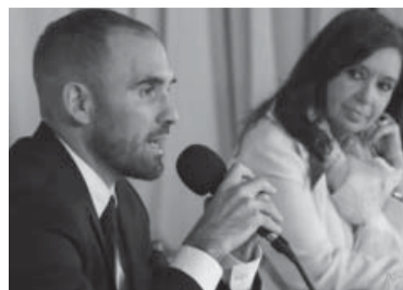
El exministro cuestionó la falta de apoyo.