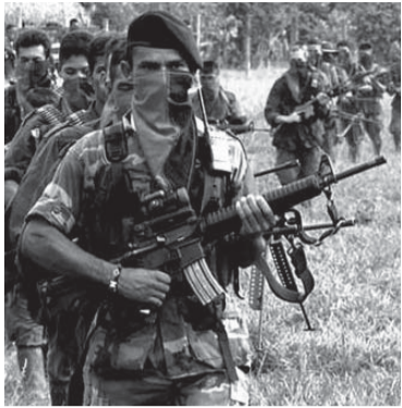
El lunes se iniciarán las negociaciones.