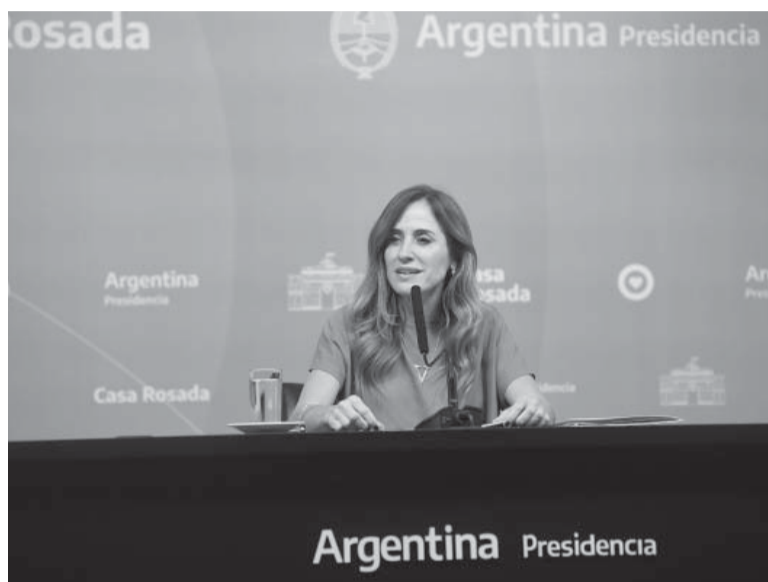
Mensaje. Tolosa Paz contra la "doble estigmatización". - Presidencia -

Por otro lado, detalló: "Al 99,7% de los que están hoy en el Potenciar Trabajo les corresponde este ingreso. Solo en el 0,3% de los casos hemos encontrado incompatibilidades y vamos a ser inflexibles. He requerido información y son 430 los que compraron dólares ahorro en los