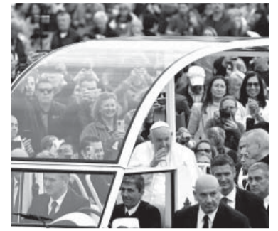
El Papa habló con La Stampa.