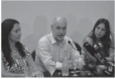
El jefe de Gobierno porteño en Salta.