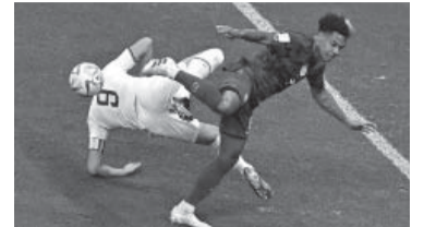
Empate 0-0.