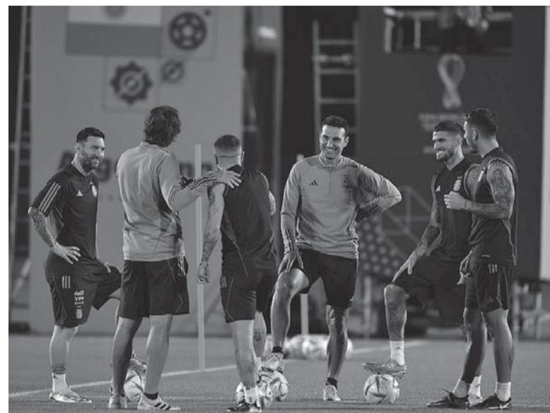
Con fe. En la última práctica se vio al grupo de buen ánimo a horas del trascendental choque ante los "Aztecas".

Tras analizar la actuación de su equipo en el debut, Scaloni adelantó que realizará cambios en la formación, pero aclaró que no cambiará el esquema táctico ni la