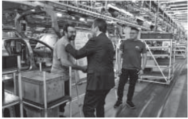
El ministro de Economía en la planta de Peugeot.