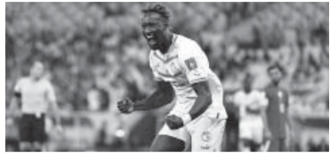
Triunfo 3-1 africano.