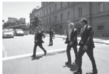
Fernández y Massa.

El presidente Alberto Fernández almorzó ayer al mediodía con el ministro de Economía, Sergio Massa, en el Palacio de Hacen-