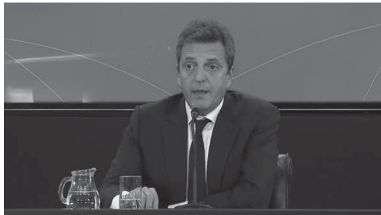
Incentivo. Massa aspira a “batir récord” de exportaciones.