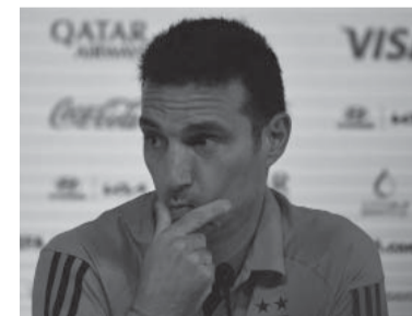
La conferencia de prensa, sin clima derrotista.

"Nosotros tenemos una manera de jugar y no la vamos a negociar. Podemos recibir un golpe pero tenemos claro que tenemos que seguir igual", insistió.