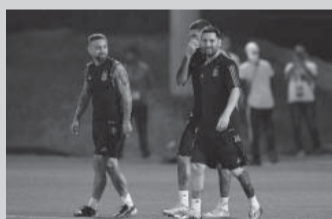
21 partidos mundialistas para el capitán.

Lionel Messi alcanzará hoy la marca de 21 partidos jugados