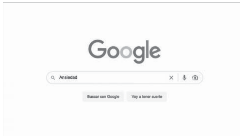
Estudio. Ansiedad, lo más buscado en internet por las y los argentinos.

El segundo tipo de padecimientos relacionados con la salud mental que generó mayor nivel de interés en los consumidores fueron los