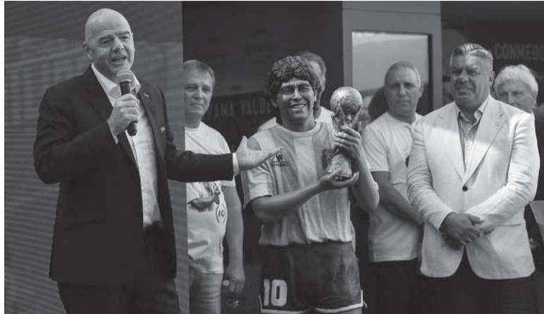
Presentes. La ceremonia incluyó, además de una estatua de Maradona, una proyección de imágenes suyas.

La ceremonia a cielo abierto, presenciada por la prensa inter-