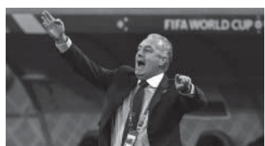
El argentino, amado en Ecuador.

Ecuador y Países Bajos, punteros del Grupo A del Mundial Qatar 2022 con 4 unidades, empataron 1-1 en el Estadio Khalifa Internacional de