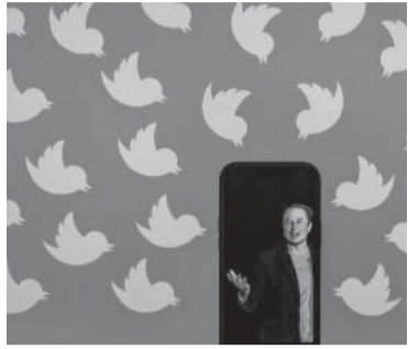
"Amnistía general".