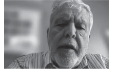
El exministro K apuntó al macrismo.