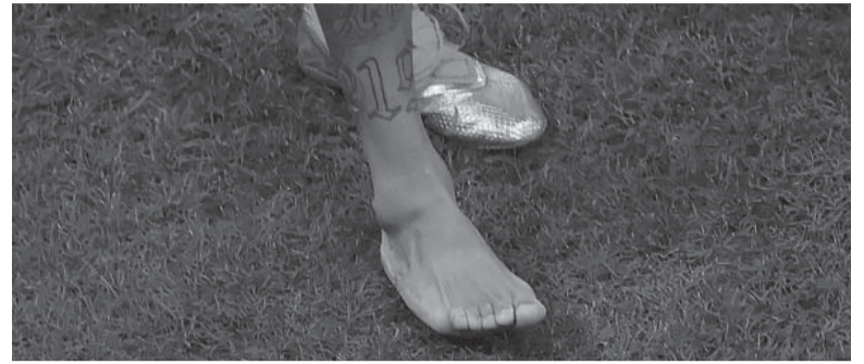
La profunda hinchazón creció con el correr de las horas.

El esguince de tobillo del astro mantiene en vilo al país: se perdería, de mínima, el resto de la fase de grupos.