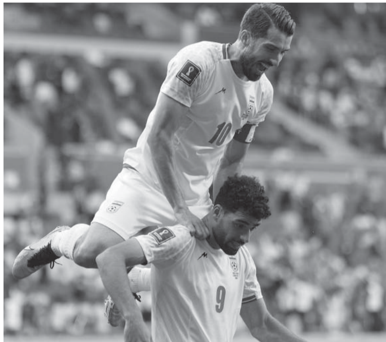
Alegría. La euforia de los jugadores iraníes, que sueñan con meterse en octavos por primera vez.

Árbitro: Mario Escobar (Guatemala). Cancha: Estadio Ahmed Bin Ali, en Al Rayan.