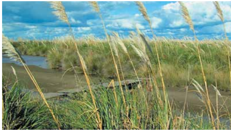
El humedal de la Bahía de Samborombón está invadido por especies exóticas y el suelo se ha salinizado.

Un estudio presentado en el “Ciclo de Seminarios del Mar”, en la Fauba, detectó cambios notables en las comunidades vegetales típicas de estos humedales, apareciendo plantas de pastizales pampeanos, de lagunas pampeanas y exóticas invasoras.