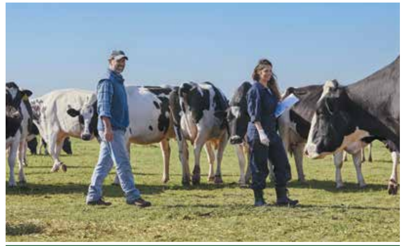
Mastellone Hermanos fue reconocida por sus avances en el bienestar animal.