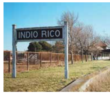
El frigorífico se levantará en Indio Rico.

El proyecto comprende una Planta Principal de 304 metros cuadrados con una cámara de frío para 40 reses y un laboratorio veterinario, un edificio auxiliar o de faena de