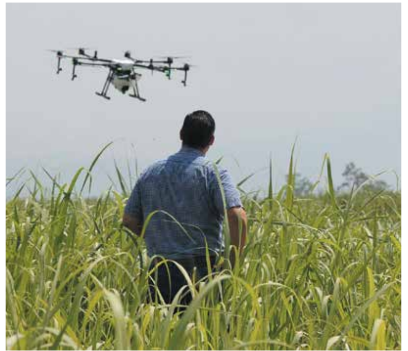
La tecnología avanza en su relación con la producción agropecuaria.

Acerca de la utilización de los datos para la toma de decisiones: casi el 70% contesta que sí. Estos datos resultan un incremento significativo respecto de los resultados de la encuesta realizada el año 2017, donde solamente un 51% de los productores respondieron que los utilizaban. ➡