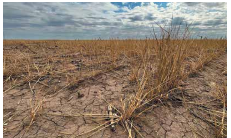
La sequía sigue siendo durísima y trece partidos pidieron la declaración de Emergencia Agropecuaria.

Rodríguez sostuvo que “la declaración de la emergencia refiere a un determinado momento y un determinado distrito. Esto tiene que ver con beneficios en materia impositiva fundamentalmente, tanto de postergación en los casos de emergencia o directamente exención. Ya hemos pasado por esto, y está previsto por la Ley de Emergencia Agropecuaria -10.390, de 1986-. Así, situaciones previas que atravesamos de altas