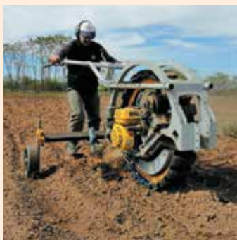
El Chango en acción.

La norma 8076-3, desarrollada en el marco de la Comisión de Tractores del Instituto Argentino de Normalización y Certificación IRAM, fue publicada en octubre de 2021. Se originó con el propósito de disponer de un documento que defina