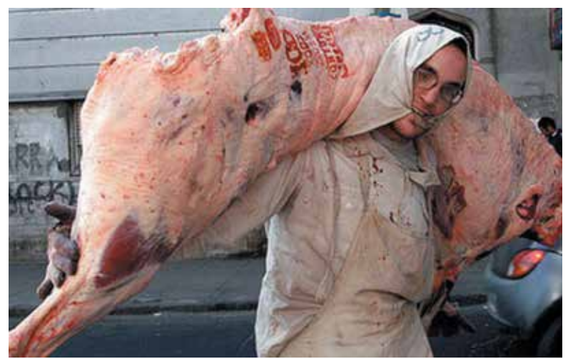
Parecía que terminaba, pero prorrogaron la media res hasta el 15 de enero.

No obstante, la mayor presión la ejerció la Federación de Industrias Frigoríficas Regionales de Argentina (Fifra) que avanzó hacia un lock out patronal en las plantas asociadas de Córdoba, Santa Fe y Entre Ríos.