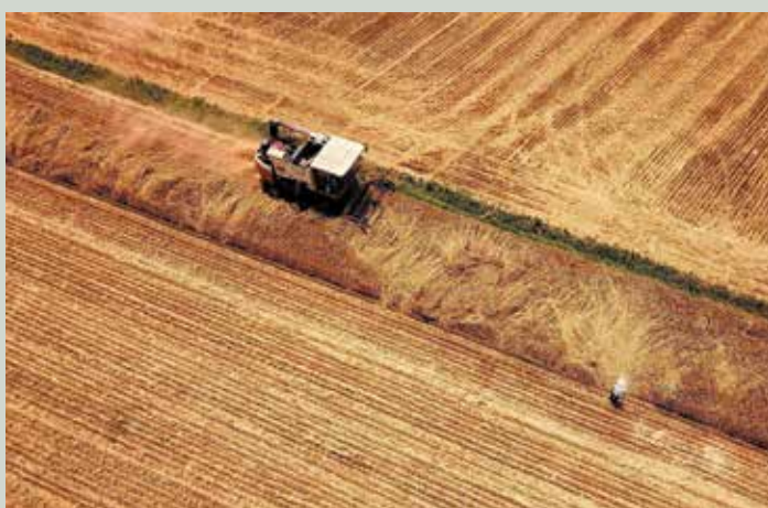
Se podrán postergar parte de los embarques trigueros.

La primera semana de noviembre el secretario de Agricultura, Juan José Bahillo, firmó una resolución que prorrogó de manera excepcional por 360 días los embarques de trigo.