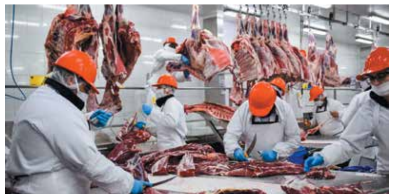
Leve baja de las ventas al exterior de carne vacuna.

Así, “China representó el 77,4% de los volúmenes exportados en septiembre de 2022; y el 76,9% del acumulado en los primeros nueve meses el año”, informó ABC.