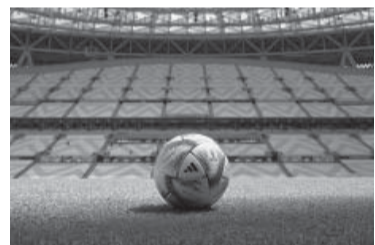
Es el turno de Al Hilm.

el nombre de Al Hilm, que en español significa "el sueño".