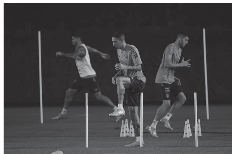
Recuperado. El "Fideo", pieza clave, está listo para regresar.

Scaloni conoce de antemano que no podrá contar con dos futbolistas por suspensión: los laterales