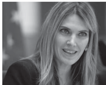
La eurodiputada griega Eva Kaili. - Archivo -