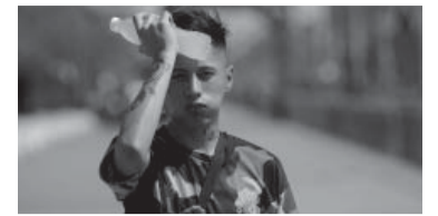
Altas temperaturas durante el fin de semana largo.