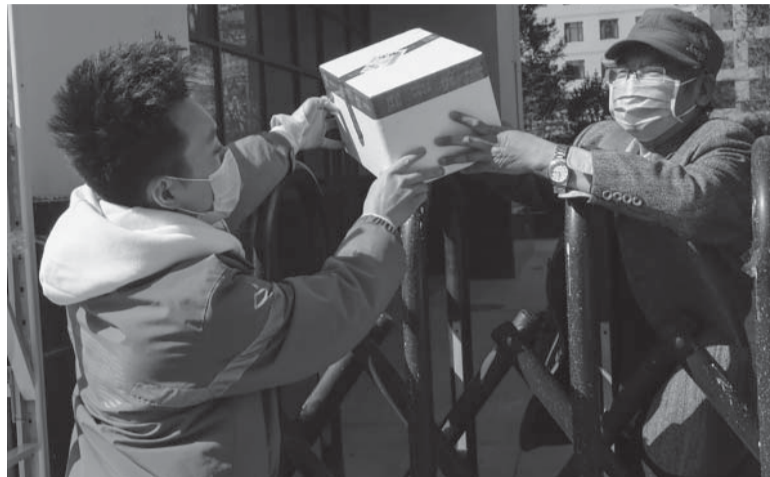
A domicilio. Sigue el fenómeno de compras online en pandemia.

El país se enfrenta a una ola de contagios para la que está mal preparado, con millones de personas mayores que siguen sin estar completamente vacunadas y hos-