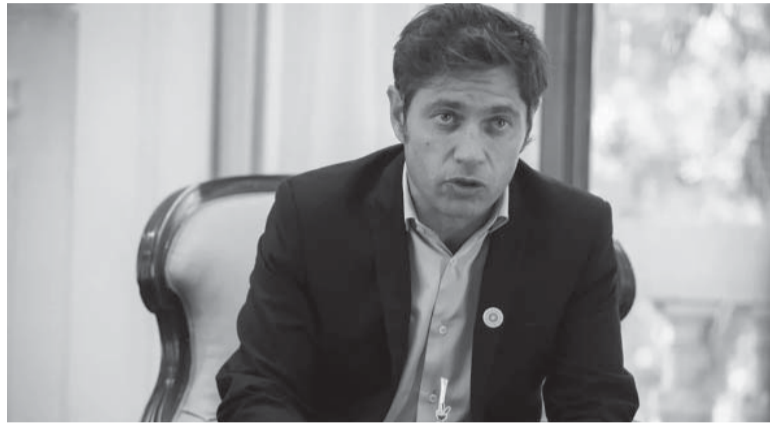
Tres años de gestión. El gobernador bonaerense Axel Kicillof.

El Gobernador además consideró que “hay que tomar muy en serio la palabra” de la vicepresidenta Cristina Fernández en cuanto a su renunciamento a ser candidata. “Tiene que ver también con una fuerza política que a veces deposita todas las decisiones, las candidaturas, en la capacidad que tiene Cristina. Bueno, que la fuerza política se haga cargo, porque es el peronismo entero el que tiene en