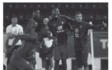
Los galos, con plena confianza para mañana.

Los últimos en contagiarse fueron los defensores Raphael Varane e Ibrahima Konaté, quienes amanecieron con síntomas y directamente