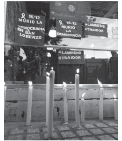
Protesta en la sede.