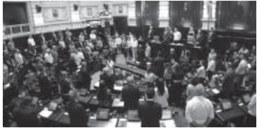
Las iniciativas avanzaron tras una tensa jornada.