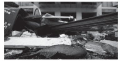
Peces muertos.