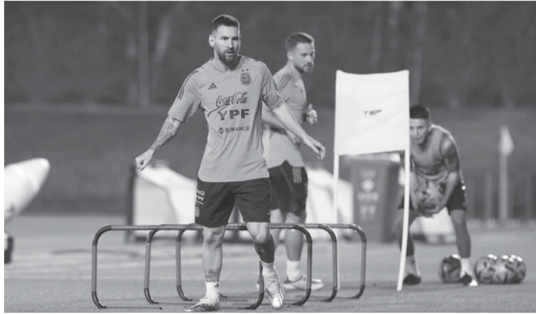
Tras un descanso el jueves, Messi entrenó a la par.

El DT del Seleccionado postergará seguramente para hoy la definición del equipo que enfrentará mañana a Francia.