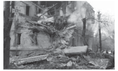
El bombardeo dejó varios muertos.