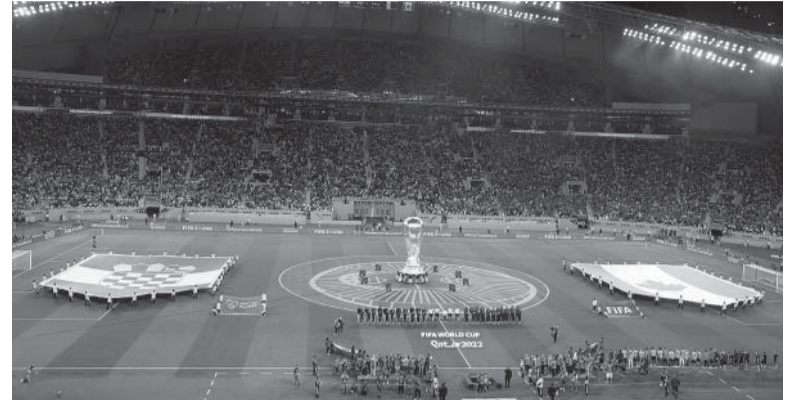
Despedida. Será el último partido en el Estadio Khalifa, en el que Croacia ya enfrentó a Canadá en fase de grupos.

Árbitro: Abdulrahman Al Jassim (Qatar). Cancha: Estadio Internacional Al Khalifa. Hora: 12 (TyC Sport y TV Pública).