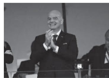
Gianni Infantino, presidente de la FIFA.

• Marruecos será sede de la Copa Mundial de Clubes de la FIFA 2022, que tendrá lugar del 1 al 11 de febrero de 2023. La Copa Mundial de Beach Soccer de la FIFA 2023 será organizada por Emiratos Árabes y la edición de 2025 por Seychelles. • Se aprobó el Reglamento de Agentes de Fútbol de la FIFA, que busca introducir estándares bá-