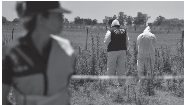
Investigación. Se realizaron peritajes de rigor en el lugar del hallazgo del cuerpo.

En el mismo sitio apareció una zapatilla Vans color negra, similar a la que usaba Morello, como así también un piercing y otras prendas de vestir, por lo que desde un inicio los pesquisas manejan la hipótesis de que se trataba de él.