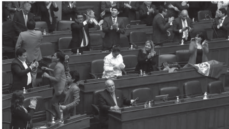
Diferencias. Los legisladores no lograron ponerse de acuerdo.

Las bancadas de izquierda y centroizquierda eran las que consi-