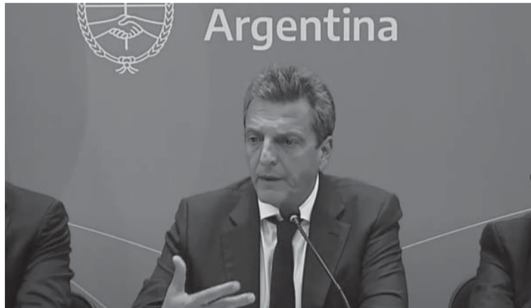
“Alentador”. Massa destacó la baja de la inflación.

Al respecto, Massa agradeció el nivel de cumplimiento “de entre el 83 y 87 por ciento” del acuerdo firmado en septiembre y que aspira a “subir ese nivel de cumplimiento” y a que el Gobierno