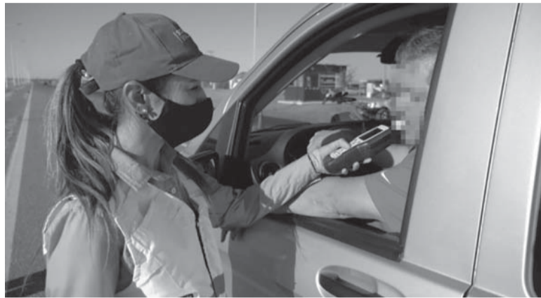
Cambio. Las provincias con leyes de tolerancia cero de alcohol para conducir tuvieron menos casos de alcoholemia positivo.

"Buscamos generar un cambio cultural en la Provincia. No pasa por el hecho de poner penas más duras, no buscamos ser recaudadores, queremos ser los promotores de un cambio que nos ayude a tener todas las vidas valen", señaló el ministro de Transporte bonaerense, Jorge D'Onofrio.