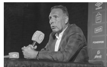
El entrenador inicia su quinta etapa en el “Canalla”.