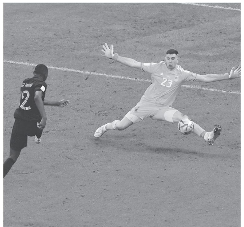
Memorable. El tapadón de “Dibu” en la última del alargue. - FIFA -

del diario El País de Paraguay publicó lo siguiente: “Se hizo justicia: Lionel Messi campeón del mundo con Argentina en la mejor final de la historia”. En Chile, El Mercurio tituló: “Argentina y Messi tocan la gloria: Ganan en penales una épica final a Francia y conquistan el tercer Mundial de su historia”. - Télam -