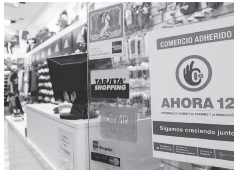
Decisión. La medida se dispuso mediante la resolución 144/2022, publicada en el Boletín Oficial. - Archivo -

En cuanto a los intereses aplicables a proveedores y comercios, para las ventas realizadas en tres cuotas, cobrarán en un plazo de hasta diez días con una tasa máxima de descuento de 7,58% (antes de 7,06%) y para las operaciones en 6 pagos con una de 14,22% (an-