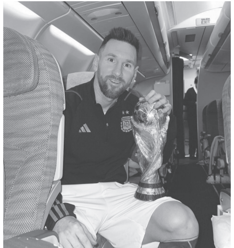
No la suelta. Messi en el avión junto al trofeo que tanto soñó. - @leomessiok -

La comitiva argentina, que cuenta con el plantel campeón completo y los dirigentes de la