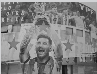
“En este suelo hay otra estrella”. - @Argentina-

Argentina logró su tercera Copa del Mundo, por lo que el escudo de la Asociación del Fútbol Argentino (AFA) sumó una nueva estrella y ya se empezaron a fabricar camisetas modificadas. Un rato después de la coronación, tras el triunfo por