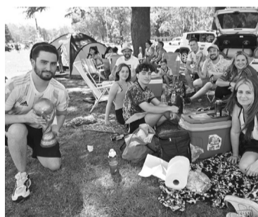
Familias enteras aguardan en Ezeiza.

Decenas de carpas fueron instaladas por hinchas en torno al predio de la AFA en Ezeiza, adonde se esperaba para des-