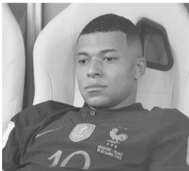
La frustración del futbolista de PSG.

Kylian Mbappé, delantero del Paris Saint Germain y de la se-