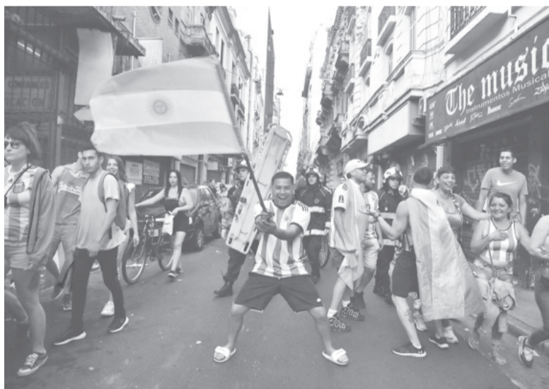
Nuevo hit para la gente.

El hit de esta Argentina campeona del mundo fue “Muchachos, ahora nos volvimos a ilusio-