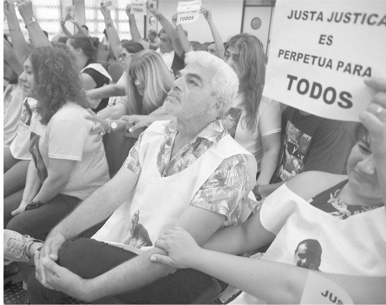
Balacera. La “Masacre de Wilde” ocurrió el 10 de enero de 1994, en el sur del Conurbano.