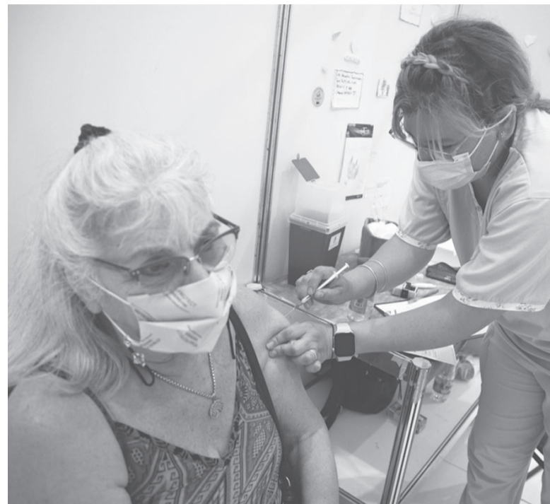
En alza. La nueva cifra semanal es la más alta desde abril. - Xinhua -

man a los centros de vacunación que funcionan diariamente en la provincia donde pueden concurrir sin turno previo y al más próximo del domicilio. Las personas deben acudir a actualizar sus esquemas y aplicarse los correspondientes refuerzos (tercera, cuarta y quinta dosis), si ya pasaron 4 meses desde la última aplicación. - DIB -