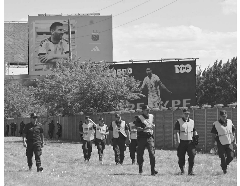
Punto de partida. La Selección iniciará su periplo en Ezeiza.

Entre los motivos del decreto, se declara asueto por "su profundo sentido religioso y conmemorativo", ya que "las citadas fechas son celebradas tradicionalmente por la ciudadanía mediante la unión y acercamiento de las familias y grupos" y debido al "traslado de muchos/as ciudadanos/as a distintos puntos de la Provincia y del país a fin de reunirse para celebrarlas". 24 y 31 caen sábado, de allí que la adminis-