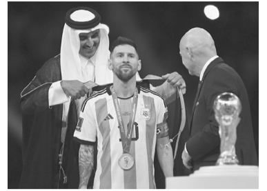
El momento en el que Messi recibe el bisht.