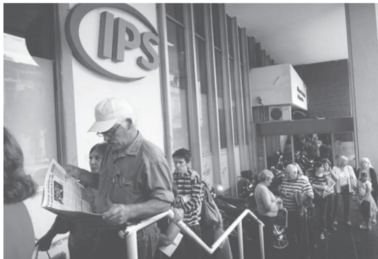
Pago. No habrá que hacer trámites para percibir la suba.

El Gobierno bonaerense anunció un incremento del 20% para las jubilaciones y pensiones mínimas que se abonará a partir de fin de mes y un refuerzo de fin de año para los beneficiarios que actualmente cobran menos de $ 50.000, medidas que llegarán a más de 45 mil personas.