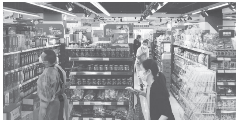
Datos oficiales. El país registró 3.049 casos nuevos de Covid-19 y ningún fallecimiento en la última jornada.

El viaje llegó después de diez meses de una guerra que ha dejado decenas de miles de muertos y heridos en ambos lados del conflicto y ha devastado ciudades de Ucrania. Estados Unidos y países de la OTAN han suministrado decenas