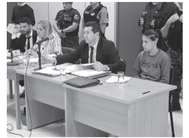
Están imputadas la madre del niño y su pareja. - Archivo -