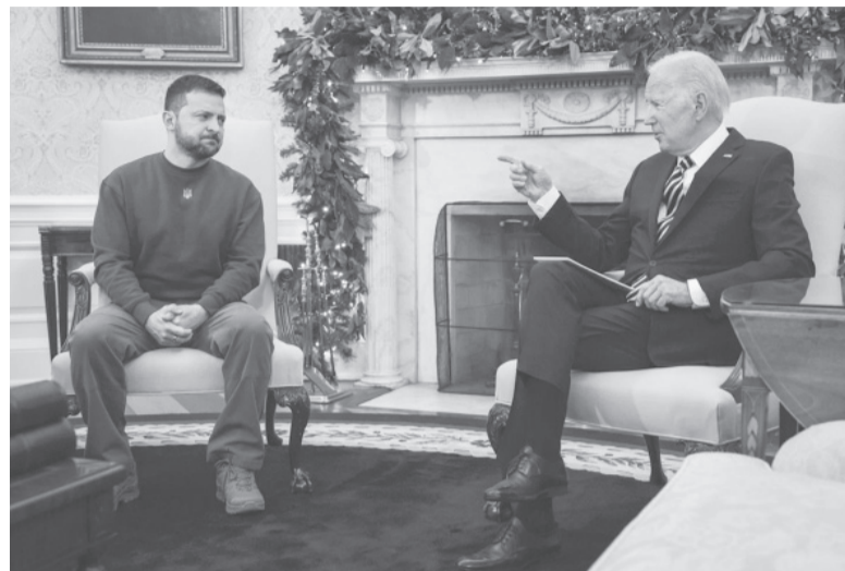
Reunidos. Los presidentes ucraniano Volodimir Zelenski y estadounidense Joe Biden, ayer, en Washington.