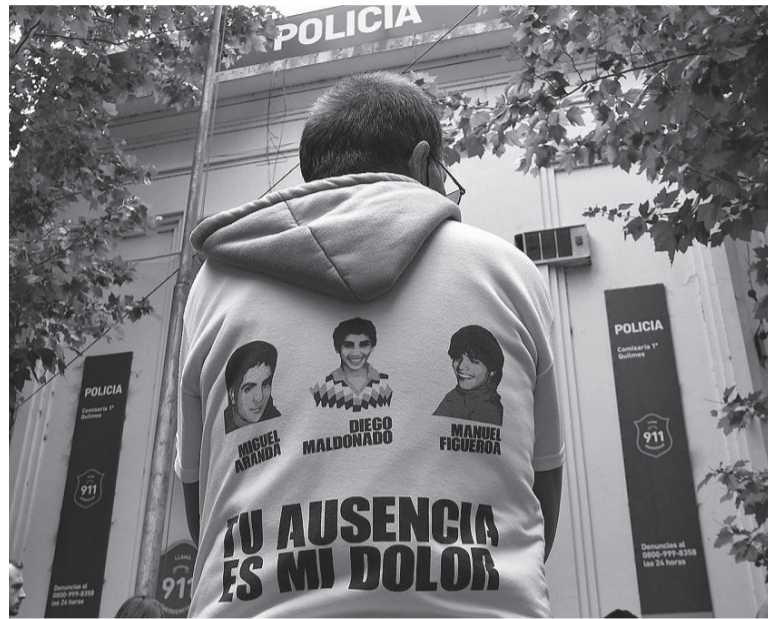
Fallo. Ya son 11 los condenados por el caso.

En el fallo de 48 páginas, el TOC 5 acreditó que la oficial ayudante "omitió adoptar medidas necesarias para evitar o interrumpir la comisión de los maltratos y tormentos