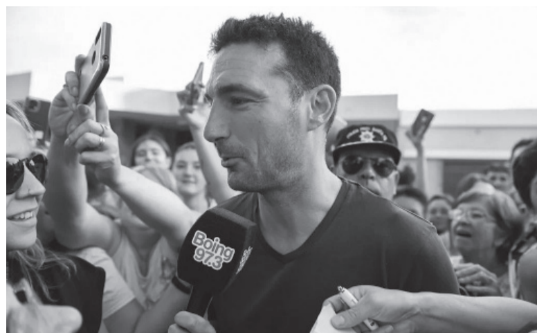
Asediado. Todos sus coterráneos se agolparon para agradecerle al mejor director técnico de los 32 mundialistas.

Previamente, en un acto público también soltó lágrimas de emoción ("pensé que ya no volvería a llorar", admitió) y ante una nutrida con-