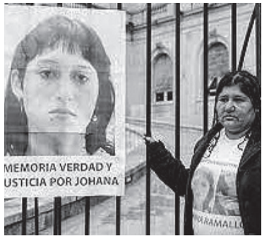
El femicidio ocurrió en 2017.