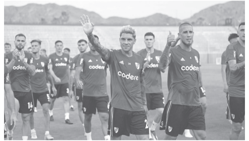
Energía renovada. Tras ocho años de "Gallardismo", el plantel de la banda intentará adaptarse a un nuevo proyecto.

El partido de esta noche ante Unión La Calera, que se jugará desde las 21.15 y será transmitido por Star+, permitirá ver en cancha la primera formación del River de Demichelis