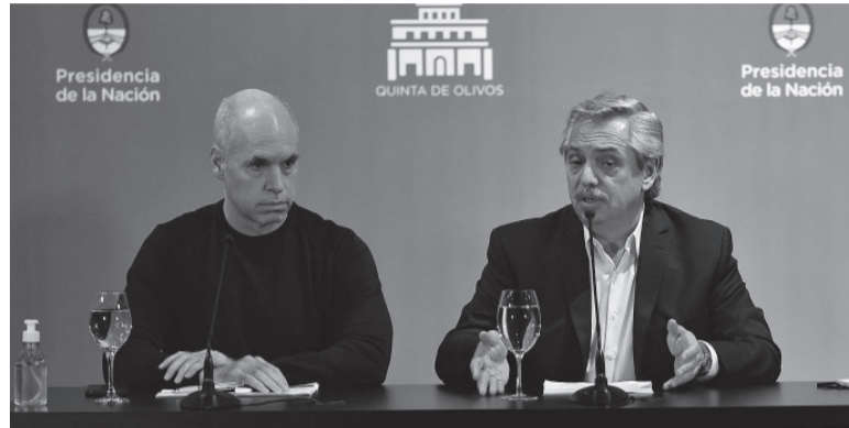
Tensión. Rodríguez Larreta le ganó la puja al Presidente.

El máximo tribunal no resolvió la cuestión de fondo sino que por el