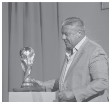
La exhibición de la Copa, una muestra de poder.

Finalmente, Tapia se emocionó al mencionar a "todos" los que hicieron "posible" el sueño de ser campeón mundial nuevamente luego de 36 años.