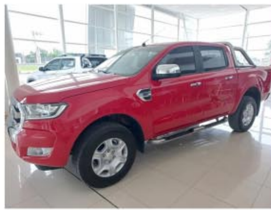
Ranger 3.2 Cd Xlt AT4x4