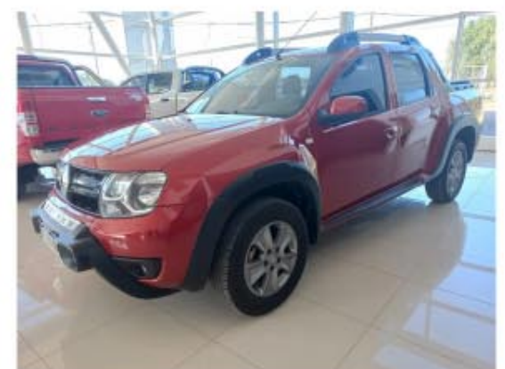
Duster Oroch 2.0 Outsider

Documentacion 100% Verificada - Usado con garantia - Tomamos tu usado en parte de pago