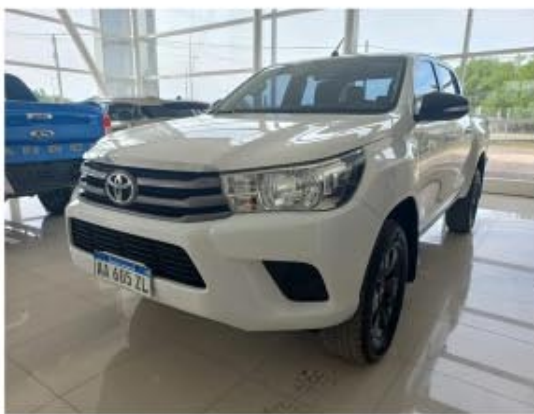
Toyota Hilux 2.8 Cd Sr 4x4