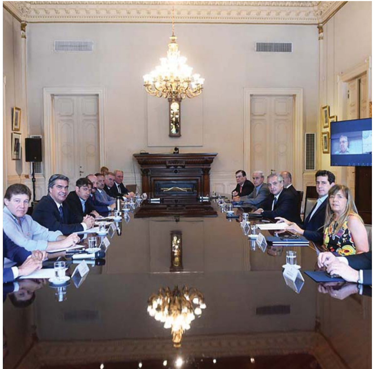
Misma mesa. El Presidente encabezó la reunión que se extendió por más de dos horas en la Rosada.

Es bajo la acusación de "mal desempeño de sus funciones" y "manifiesta parcialidad" a la hora de dictar fallos. Fernández y doce mandatarios provinciales advirtieron ayer que existe el peligro de avanzar hacia un "gobierno de los jueces". - Pág. 3 -