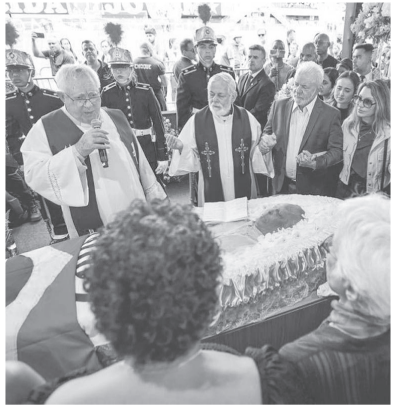
Respeto. El sepelio de Edson Arantes do Nascimento duró 24 horas y contó con la presencia de Lula da Silva.

El velorio fue a cajón abierto y, durante la madrugada, hubo una fila de una extensión de dos kilómetros con personas que aguar-