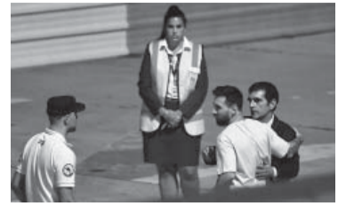
La llegada del astro. - PSG -