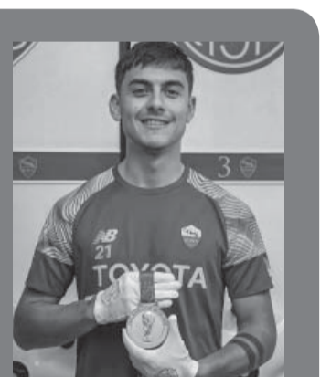
La medalla donada.