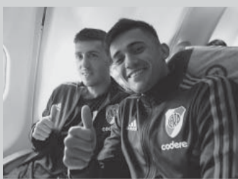
El plantel aterrizó ayer en Miami. - CARP -

La delegación, con un total de 31 futbolistas, llegó al hotel cerca de las 19 horas de nuestro país y tuvo el recibimiento de varios centenares de hinchas de la filial local, quienes organizaron un banderazo