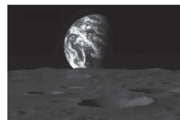
Fotos de la Luna y la Tierra.

Estas imágenes, que datan entre el 24 de diciembre y el 1 de enero, se tomaron a menos de 120 kilómetros de la superficie lunar,