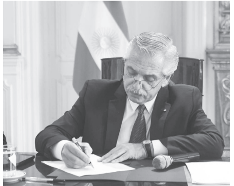
Decisión. Alberto Fernández encabeza la reunión.

El pedido de enjuiciamiento recién se podrá tratar cuando el Gobierno envíe la convocatoria a sesio-