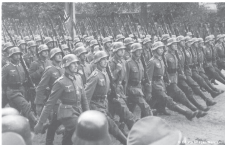
Invasión. Entrada nazi a Polonia en septiembre de 1939.