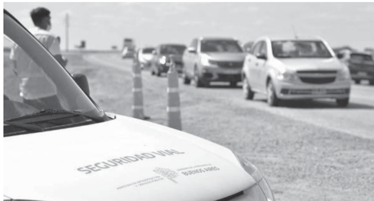
Seguridad vial. Los controles se profundizarán en las rutas bonaerenses. - DIB -

La Justicia porteña ratificó la obligatoriedad de pagar las multas por infracciones de tránsito en todo el país como requisito para renovar el registro de conducir automóviles en la Capital Federal. - DIB -