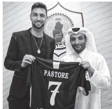
El cordobés no jugará en Talleres. - Twitter -

El mediocampista argentino Javier Pastore fue presentado ayer como nuevo jugador de Qatar Sports Club, equipo de la Liga qatarí, informó el club del país del oeste de Asia. El futbolista cordobés rescindió el contrato que lo ligaba hasta el final de la temporada con Elche de España y ayer fue presentado oficialmente en su nuevo club. Pastore, de 33 años, posó ayer con la camiseta de Qatar SC en la tribuna del estadio y mostró que usará el número 7. - Télam -