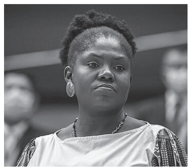
Francia Márquez.