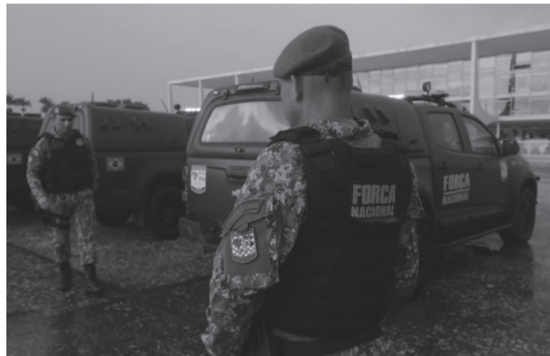
Refuerzo. Las calles de la intervenida Brasilia.

"Absolutamente nada justifica la existencia de campamentos repletos de terroristas, patrocinados por diversos financistas y con la complacencia de autoridades civiles y militares en total subversión al necesario respeto a la Constitu-