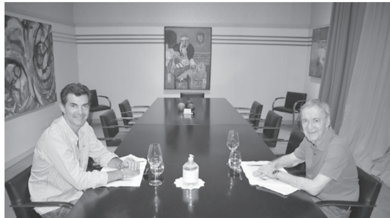
Juntos. En su presentación destacaron que no están por ambiciones personales. - DIB -

Y agregó que no hay “una mirada federal en la Argentina” y consideró que “un país con más de 170 impuestos es un desorden”.