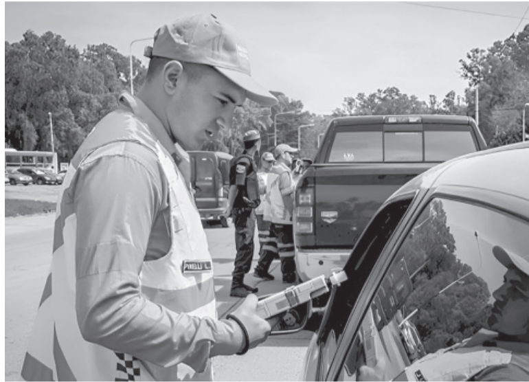
Controles. Ya rige la ley de Alcohol Cero en la provincia de Buenos Aires. - DIB -

En declaraciones radiales al programa Siempre es hoy (AM 530) dijo que "el gobernador Axel Kicillof en febrero mandó el proyecto a la Legislatura, lo hemos tratado con muchísima responsabilidad generando un gran volumen de debate". En esa línea, el ministro sostuvo que "de mitad de año para