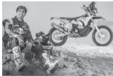
El corredor salteño sufrió un fuerte golpe.

Ilusionado con otra consagración, después de coronarse hace dos años con el equipo Honda, el sal-