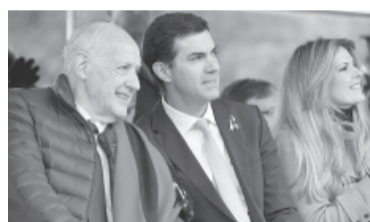
Sin Lavagna. Esta vez el economista no será parte de la fórmula.