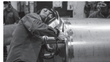
Aumenta expectativa de empleo en el primer trimestre.

■ EXPORTACIONES. La provincia de Neuquén alcanzó durante los primeros 11 meses de 2022 exportaciones de hidrocarburos por más de 2.100 millones de dólares, acumulando envíos por más de 19,7 millones de barriles de petróleo y 1.400 millones de metros cúbicos de gas.