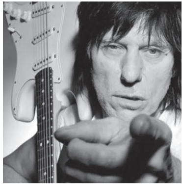
Jeff Beck.