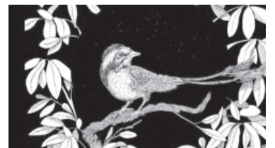
Yatenavis ieujuensis. - Conicet -

En tanto, las muestras tomadas a las personas afectadas están siendo remitidas al Laboratorio Central de Salud Pública de Santa Catarina (Lacen) para identificar el agente causal de la epidemia. Según las autoridades de la Junta de Vigilancia, las enfermedades diarreicas agudas pueden ser causadas por virus, bacterias y hongos, y que algunos factores que contribuyen a que una persona contraiga diarrea son: la ingestión de agua contaminada, hielo o alimentos de origen desconocido; consumo de carnes, pescados y/o mariscos crudos o poco cocinados. - DIB -