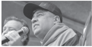
Moyano le habló a la oposición.