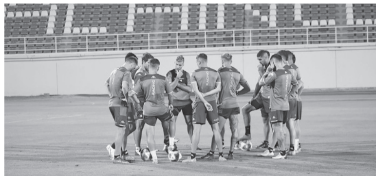
Día I B. Tareas regenerativas en Racing.

quero de Tigre (surgido en Boca) se mantiene en la carrera por ocupar el arco este viernes.