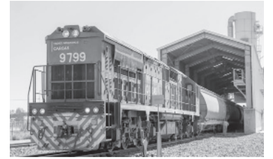
Mejora del 57%.