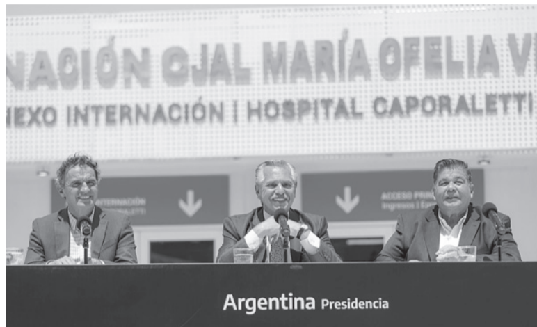
Conflicto. El mandatario volvió a apuntar a la Corte.

“A mí no me tiene que agradecer nada, sólo cumplo con mi deber. Tenemos más de 2.800 obras terminadas y eso me da mucho orgullo”, señaló Fernández en un acto al que asistieron el ministro de Obras Públicas, Gabriel Katopodis,