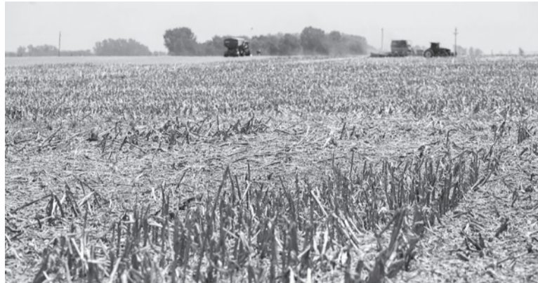
Caída. El Estado dejaría de percibir más de mil millones.

"Cuando hablamos de la pérdida de ingresos netos del sector productor nos referimos a la diferencia entre el margen neto del productor que éste estimaba al momento de la siembra, con un rinde promedio en