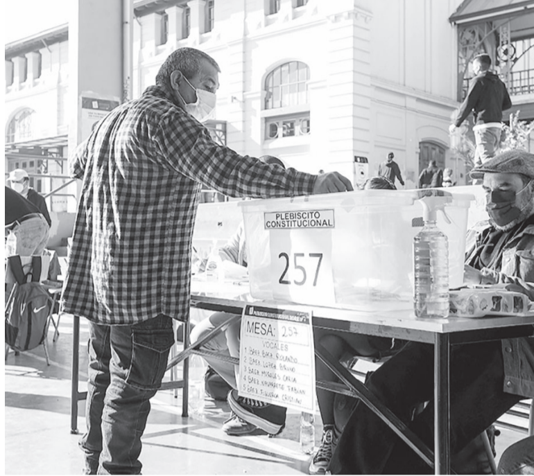
En no. En septiembre el 61% de los chilenos decidió no aprobar el texto constitucional.

Para ser integrante de la Comisión Experta es necesario tener derecho a sufragio, título universitario o grado académico, además de acreditar experiencia laboral no inferior a diez años en el sector público o privado. Posteriormente, el 7 de mayo, en una elección con voto obligatorio, se elegirán 50 miembros del Consejo Constitucional más escaños para consejeros de pueblos indígenas de acuerdo