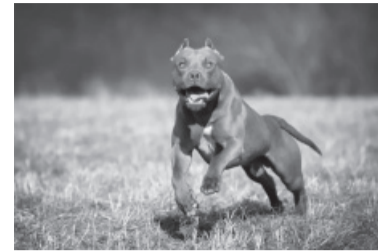
Perro pitbull. - DIB -