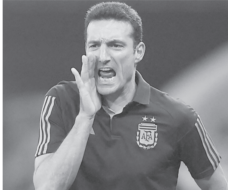
Campeón. Lionel Scaloni, hacedor del equipo ganador.