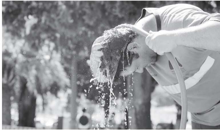
Datos. Si se llega a las marcas pronosticadas; entonces se entraría en ola de calor. - DIB -

Fernández explicó que "no hay áreas bajo ola de calor a nivel país, pero sí hay algunas ciudades del