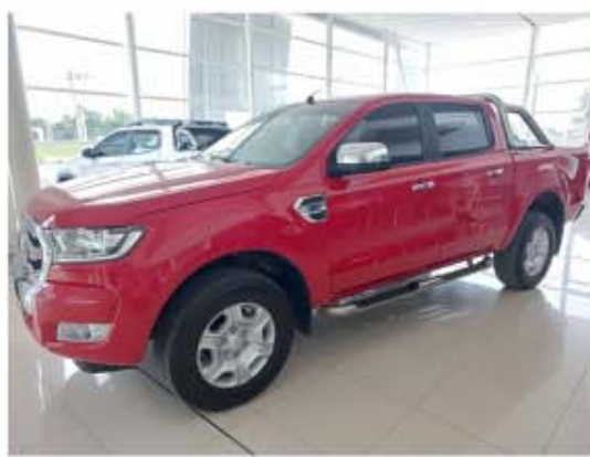
Ranger 3.2 Cd Xlt AT4x4