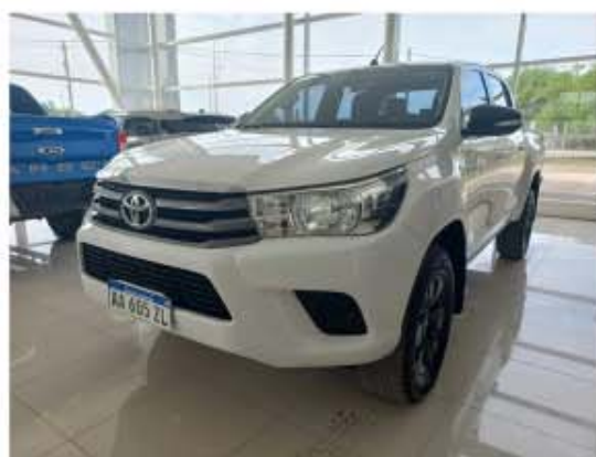
Toyota Hilux 2.8 Cd Sr 4x4