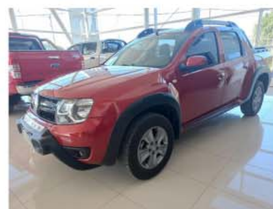
Duster Oroch 2.0 Outsider

Documentacion 100% Verificada - Usado con garantia - Tomamos tu usado en parte de pago