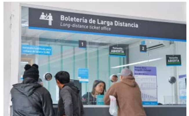
da sujeto a la política de devolución de la empresa.

En caso de no cumplir el trámite, se pierde el derecho a viajar, no se puede acceder a la formación y el reintegro del importe que-