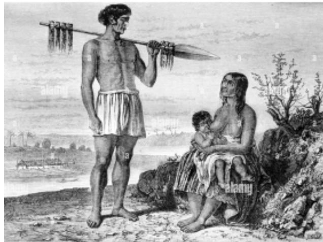
“Los guaraníes parecen felices de vivir como sus antepasados”.

Recordando la llegada de la Navidad. Durante varios años hubo gente dedicada a llevar panes dulces a los detenidos en la Comisaría de Bragado. Después dejaron de estar los calabozos... y los encargados