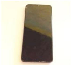
En horas de la tarde de ayer la policía realizó dos