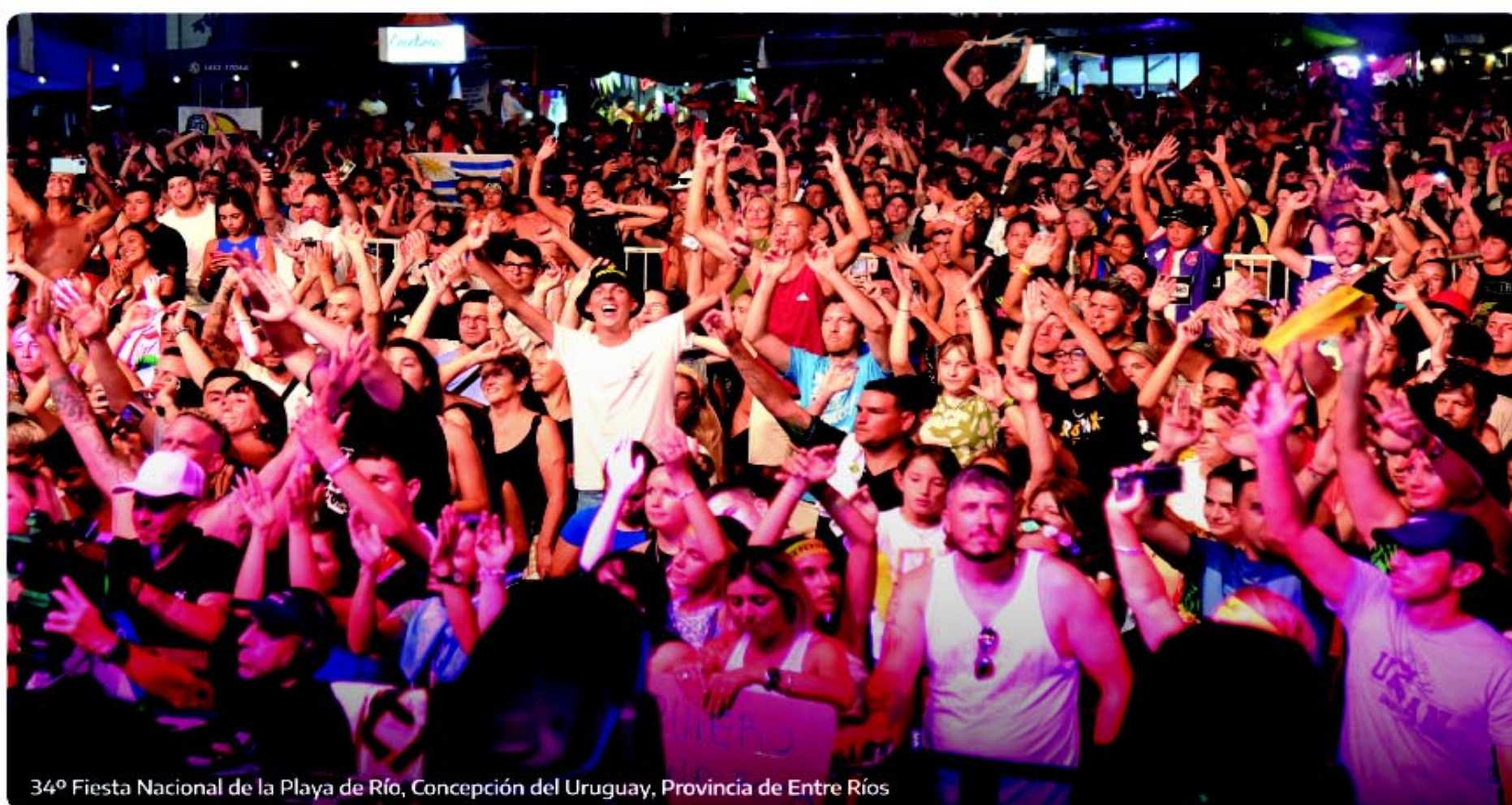
34º Fiesta Nacional de la Playa de Río, Concepción del Uruguay, Provincia de Entre Ríos

El Gobierno nacional acompaña a más de 430 celebraciones que fomentan el desarrollo de las economías regionales y generan más trabajo y producción.