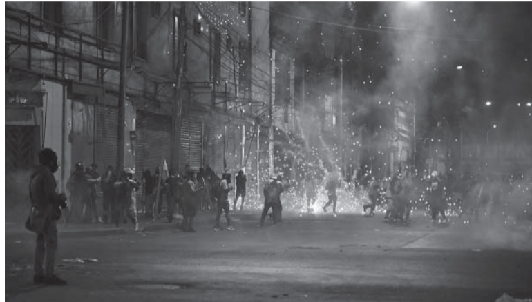
Repetidas. Sábado a la noche, nueva jornada de tensión en Lima. - AFP -

La nueva protesta se realizó un día después de que el Congreso bloqueó hasta agosto cualquier debate para adelantar las elecciones generales. Con esta decisión basada en tecnicismos procedimentales, el Congreso dio un portazo a la posibilidad renovar la Presidencia y el Congreso en 2023, como claman los manifestantes desde diciembre en protestas que han dejado 48 muertos. - Télam -