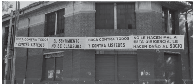
Clima político tras la clausura de la Tribuna Superior Sur. - @PlanetaBoca -

complemento dio un paso atrás: ni siquiera generó peligro más allá de alguna aproximación a fuerza de centros.