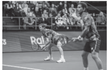
La historia empezó a complicarse con la caída del dobles. - AAT -

Finlandia, que jugará por primera vez contra los países de elite en la fase de grupos de las Finales en septiembre, tuvo como figura excluyente a Emil Ruusuvuori, 43 del mundo y de juego dúctil sobre canchas rápidas, debido a que ganó sus dos singles y también el punto de dobles que jugó junto a Harri