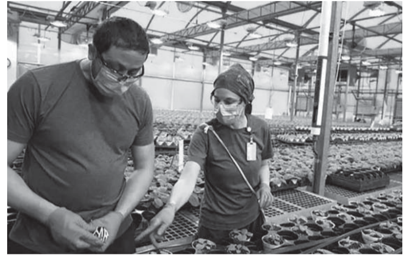
Avance. Las plantas son capaces de operar como biorreactores para sintetizar vacunas para diversas enfermedades, como la Covid-19. - Agrofy New -

Según una investigación de Persistant Market Research, las vacunas virales ocuparon el 53,2% de la cuota de mercado mundial en 2021, mientras que las vacunas desarrolladas a partir de ADN o ARN prácticamente completan el panorama. Entre las vacunas de origen vegetal, el maíz es el principal insumo y ocupó el 38,6% de la cuota de mercado mundial de vacunas de origen vegetal en 2021. Por aplicación, el virus de la influenza representó una participación de mercado del 35,9% en 2021. Los principales actores se centran en la producción de vacunas y anticuerpos terapéuticos, junto