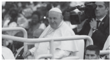
El Papa a bordo del Papamóvil.