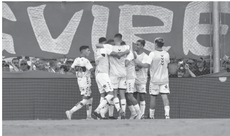
Sólido. El equipo de Palermo fue infalible en defensa.

Stilitano, arrancó el segundo tiempo con mayor convencimiento e intentó jugar en campo rival, aunque sin poder generar jugadas de peligro.