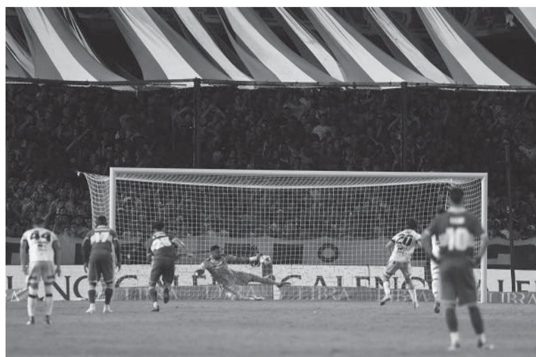
Salvada. El momento en el que "Chiquito" no hizo extrañar a Rossi. - Télam -

En lo que respecta al juego, el conjunto napolitano goleó 3-0, sumó su quinta victoria consecutiva y se afianzó aún más en la cima de la Serie A. - Télam -