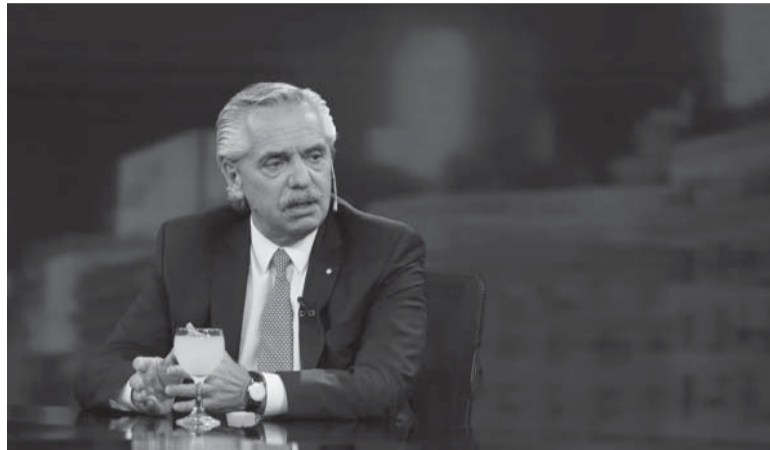
A la cabeza. Fernández, también presidente del Partido Justicialista.

"Es mi intención que los referentes que confluimos con miradas