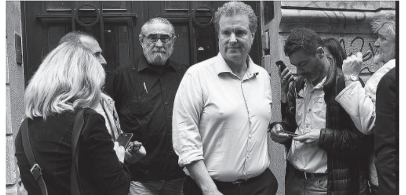
Celulares. El Diputado opositor en la mira. - DIB -

Fue un pedido de los abogados de la Vicepresidenta, querellantes en el caso, puesto que la jueza Capuchetti sólo había ordenado examinar los celulares en lo que hace a la jornada del 30 de agosto pasado, un día antes del atentado, y cuando supuestamente