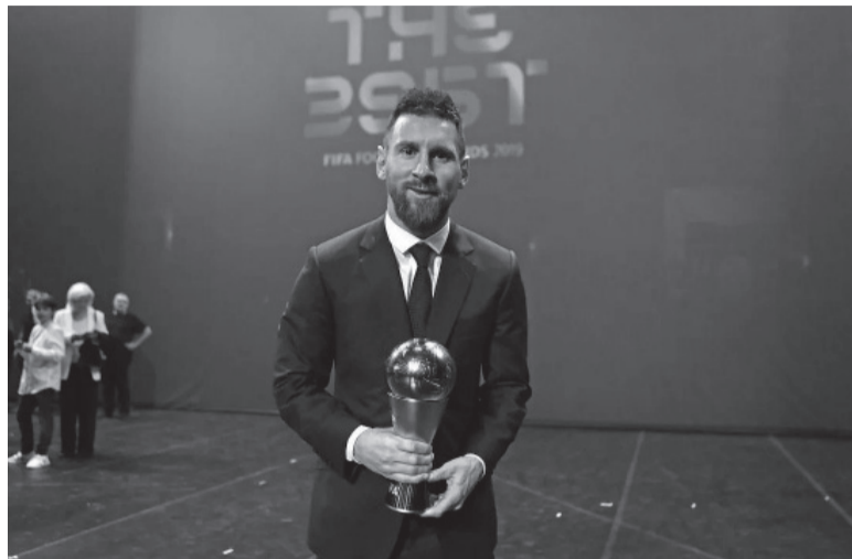
Favorito. Se cae de maduro que "La Pulga" reincidirá en la distinción que ya ganó en la edición 2019.

Por su parte, Benzema no pudo estar con el seleccionado francés en Qatar por una lesión, pero tuvo una destacada labor al