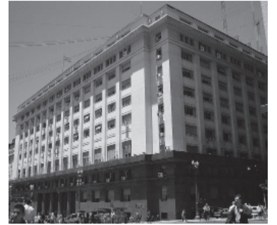
El edificio en Plaza de Mayo.