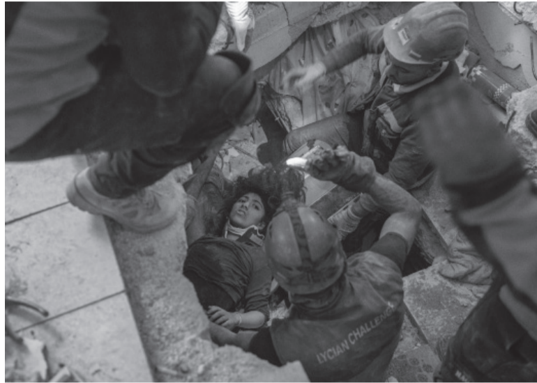
Socorristas. Rescate a una mujer en la ciudad turca de Kirikhan.

Los sobrevivientes del terremoto en Siria acudieron a los campamentos creados para los desplazados a causa de la guerra civil. Muchos perdieron sus casas o tienen miedo de regresar a unos edificios dañados por el temblor. El sismo le costó la vida a más de 23.000 personas, de las cuales más de 3.500 vivían en territorio sirio, mientras que en la guerra siria murieron alrededor de medio millón de personas. La contienda obligó a huir de sus casas a cerca de la mitad de la población que sumaba el país antes de la guerra. Muchos de ellos encontraron cobijo en la vecina Turquía.