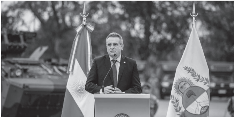
El funcionario dejaría la Agencia de Inteligencia.

Ingresaría por Manzur. Fernández define quien lo reemplaza en la AFI.