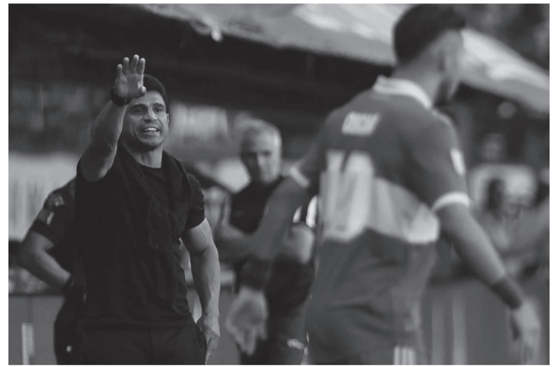
Incómodo. Al DT no se le reclaman tanto los resultados, sino la decisión de no incluir a juveniles como Fernández o Langoni.

Es decir que sacó de la cancha a tres futbolistas muy cuestionados, más el colombiano Villa que suele jugar cada partido de manera individual y cuando está inspirado Boca generalmente gana, pero cuando