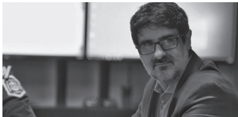
Investigación. Sede del Ministerio Público Fiscal (Edificio "San José") de Junín. - La Verdad -

Se trata de una asociación ilícita que robó del depósito de secuestros de las fiscalías de aquel distrito bonaerense.