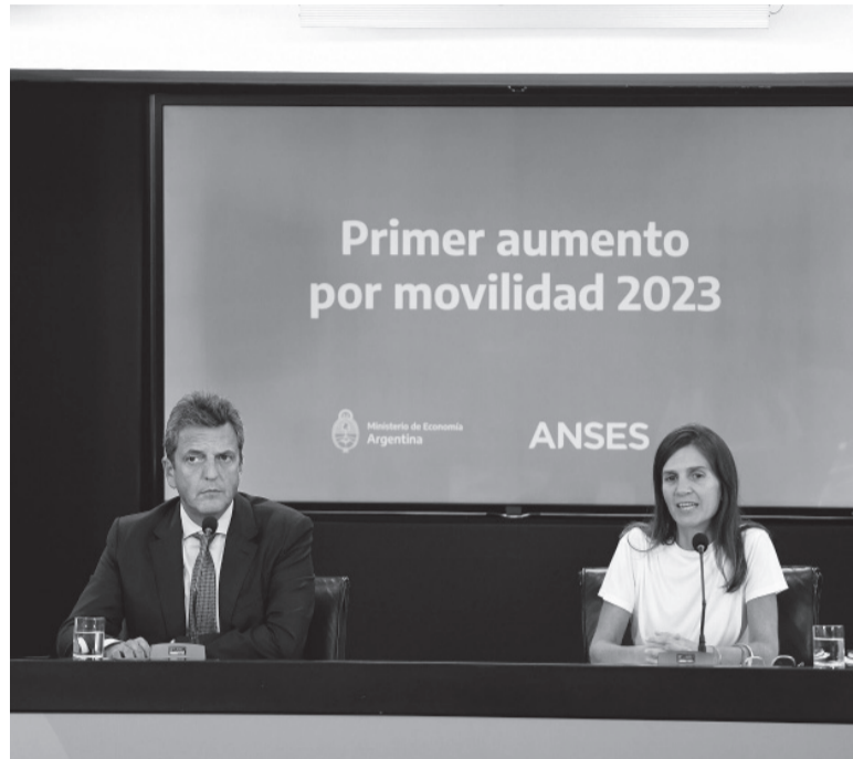
Conferencia. Massa y Raverta en el anuncio del incremento.

■ En marzo, las jubilaciones y pensiones del sistema previsional general de la Anses tendrán un reajuste de 17,04%, según se anunció oficialmente ayer. La recomposición alcanzará también a las pensiones no contributivas y a las asignaciones por hijo (tanto a la AUH como a las prestaciones que perciben asalariados formales y monotributistas). Además, habrá un bono de $15 mil para quienes cobren el haber mínimo y de $ 5 mil para los que perciban el equivalente a haberes. El aumento anunciado es el primero de 2023 que se otorga según la fórmula de movilidad de la ley 27.609, aprobada a fines de 2020 y que el año pasado dio un resultado muy por debajo de la inflación: mientras que las subas de haberes determinadas por ese cálculo acumularon un 72,48%, el aumento generalizado de precios trepó a 94,8%. El gobierno, lo compensó con bonos, por eso en la práctica los haberes de los pasivos no perdieron contra la inflación. Con la nueva suba, que fue anunciada por el ministro de Economía, Sergio Massa y la directora ejecutiva de la Anses, Fernanda Raverta, el haber mínimo pasará de $50.124,26 a $58.665 y el máximo, de $337.288,80 a $394.763 (valores en bruto). Massa, que suma en el cálculo el bono, informó que ahora el haber mínimo real es de $73.665. La Asignación Universal por Hijo,