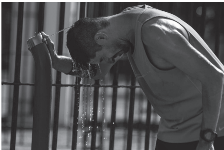
Agobiante. La ciudad de Buenos Aires atraviesa una ola de calor.

La actualización de temperaturas de las 14 mantuvo en los primeros puestos a localidades bonaerenses, ubicando en primer lugar de la tabla Bahía Blanca (39.3); en el quinto puesto a Morón (36.9), La