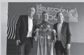
Otro argentino dirigirá al "Tri". - seleccionmx -

En conferencia de prensa en el Centro de Alto Rendimiento de la FMF, al sur de la Ciudad de México, Ares de Parga detalló que en el proceso de elección del nuevo entrenador del "Tri" fueron entrevistados cinco candidatos. Los requisitos que cumplió