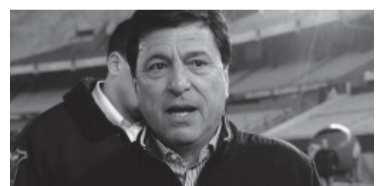
El "Kaiser" volverá al Monumental tras muchos años.

"Estuve hace poco en el club y he ido en todo este tiempo. Tuve una relación muy buena con los hin-