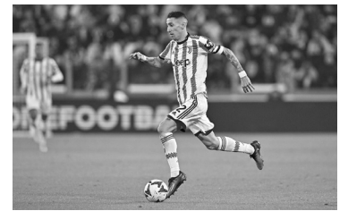
El "Fideo", importante para el 1-0 sobre Fiorentina. - Juventus -