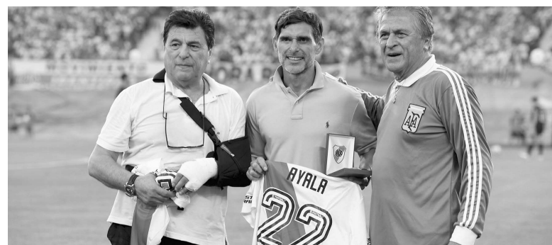
Passarella fue uno de los homenajeados por el club de Núñez. - Télam -

Argentinos recuperó la pelota y sobre el final tuvo el empate dos veces: primero con un cabezazo de Redondo que rozó el travesaño y luego con un gol anulado por fuera de juego, en el último minuto, que motivó la intervención del VAR. - Télam -