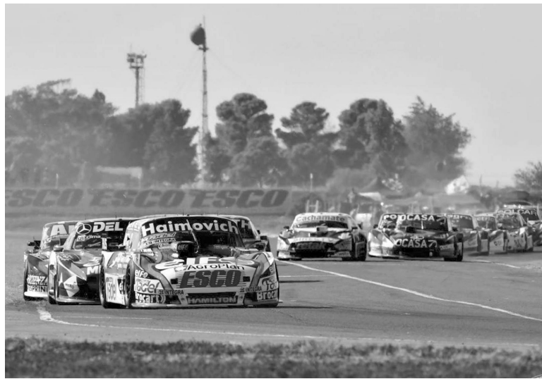
Vigencia. El máximo referente de Ford ganó al menos una vez por temporada desde el 2011.

"Matías (Rossi) me hizo cometer equivocaciones porque andaba muy rápido, me exigía en todos los