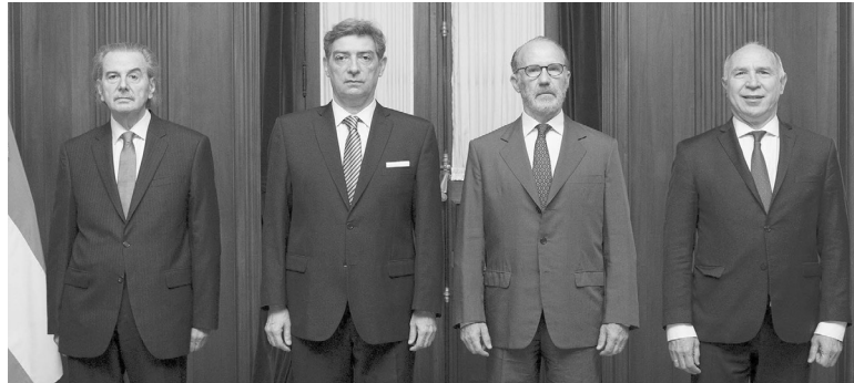
Máximo tribunal. Maqueda (izq.), Rosatti, Rosenkrantz y Lorenzetti.

La posibilidad de convocar a las partes de un litigio al Palacio de Tribunales para que ofrezcan sus argumentos es un instituto que la Corte ordenó en 2007 para “elevar la calidad institucional en el ámbito del Poder Judicial y profundizar el estado constitucional de derecho”. Cuando Rosatti llegó a la presidencia de la Corte, en octubre de 2021, acordó con Rosenkrantz y Maqueda recuperar este procedimiento. Así, el año pasado se debatió largamente en el Palacio de Talcahuano el uso del cannabis