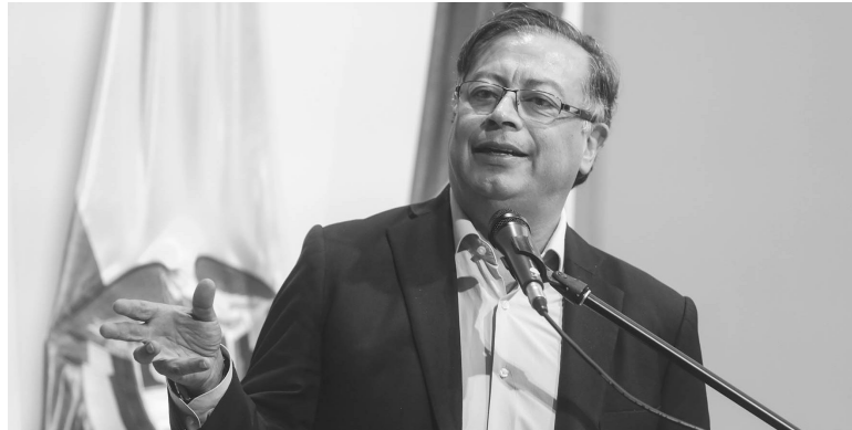
Compromiso. El presidente Petro y su política de "paz total".

Aunque las autoridades canadienses esperaron a derribar el objeto hasta que fue posible identificarlo visualmente, el Gobierno no quiso ofrecer ningún detalle sobre el arte-