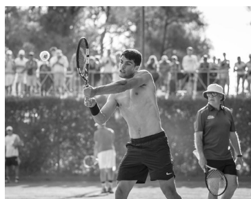
El español debuta directamente en los octavos de final. - ArrgentinaOpen -

Por su parte, el austríaco Dominic Thiem (96), quien alzó el trofeo en el Argentina Open dos veces, en 2016 y 2018, y de a poco regresa a los primeros planos luego de haber estado más de un año inactivo por