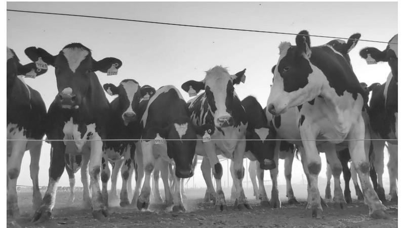
Tensión. Los productores tamberos encuentran una clara provocación, con una baja del precio percibido por el productor, bajo una amenaza de cierre en las exportaciones. - Mundo Rural -

cute sobre todas las decisiones en el tambo: no ayuda a cuidar el ambiente, ni los animales, ni las personas que trabajan a diario. Es más, se está contribuyendo a la