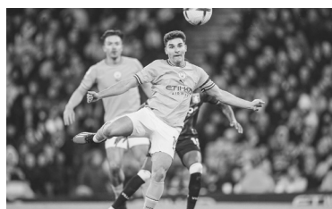
El argentino reemplazó a Erling Haaland. - Manchester City -

el otro equipo de la ciudad había despachado por 2-0 a Leeds con un tanto del argentino Alejandro Garnacho.