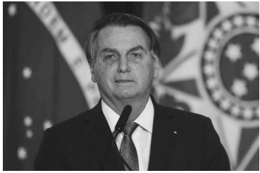
Jair Bolsonaro.