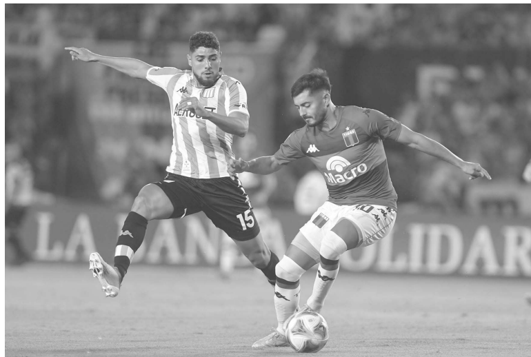
Mal arranque. El equipo de Gago sumó dos de nueve posibles.

Pero poco le duró la alegría a "La Academia", porque apenas tres minutos después, cuando se cumplía el cuarto de hora inicial, una cuestionable intervención del VAR