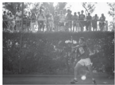
El español jugará en el último turno. - AOpen -

El tenista español Carlos Alcaraz, número dos del planeta, enfrentará hoy al serbio Laslo Djere por los octavos de final del Argentina Open, en el partido que acapara la mayor atención de la jornada. La programación completa del torneo que se juega en el Buenos