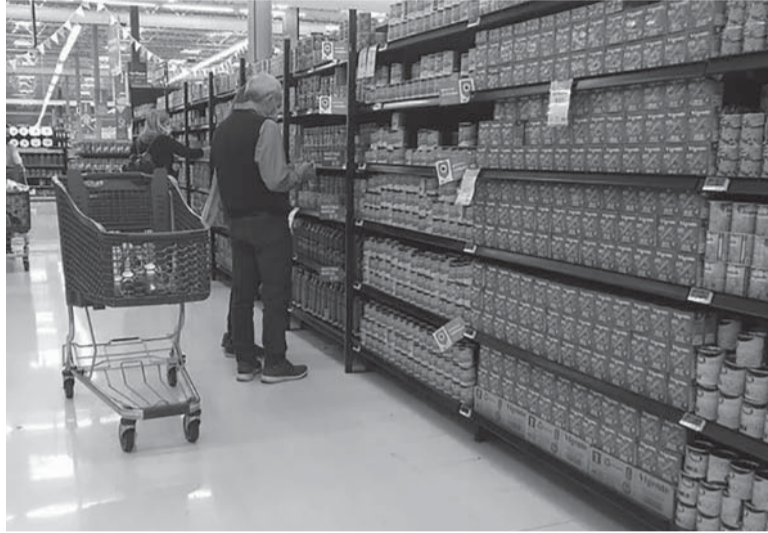
Alimentos. Uno de los rubros más sensibles, subió el 6,8%. - DIB -

En tanto que la división de mayor aumento en el mes fue Recreación y cultura (9,0%), principalmente por la incidencia que tuvo el aumento de los servicios de turismo a raíz de la temporada de vacaciones, y del servicio de televisión por cable. Siguió en importancia en términos de mayor suba mensual las divisiones Vivienda, agua, electricidad y otros combustibles (8,0%), impulsada en gran parte por el alza de las tarifas de servicios públicos, y Comunicación (8,0%), por las subas en los servicios de telefonía e internet. Las dos divisiones de menor variación en enero fueron Prendas de vestir y calzado (2,3%) y Educación (1,1%). De esta manera, el índice vuelve a recalentarse luego de las bajas de noviembre (4,9%) y diciembre (5,1%), y retoma