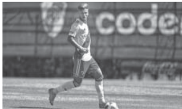
El mediocampista central retornaría a final de año.

"¡Quería agradecer a todos por los mensajes y