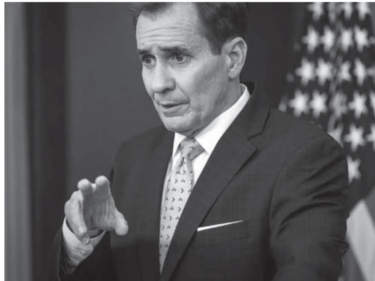
Paños fríos. John Kirby, portavoz del Consejo de Seguridad Nacional.

En el marco de esa polémica, la Casa Blanca aseguró ayer que no hay indicios de que los tres objetos voladores derribados el viernes sobre Alaska, el sábado sobre el Yukón, en el noroeste de Canadá, y el domingo sobre el norteño lago Hurón "fueran chinos o espías". Las autoridades estadounidenses hasta ahora "no han visto ningún indicio ni nada que apunte específicamente a la idea de que estos tres objetos formaban parte del programa de globos espía de China o estaban involucrados en esfuerzos de recopilación de inteligencia externa", dijo a periodistas John Kirby, portavoz del Consejo de Seguridad Nacional. "Podrían ser globos que simplemente estaban vinculados a entidades comerciales o de investigación y, por lo tanto, inofensivos", agregó el funcionario, quien, no obstante,