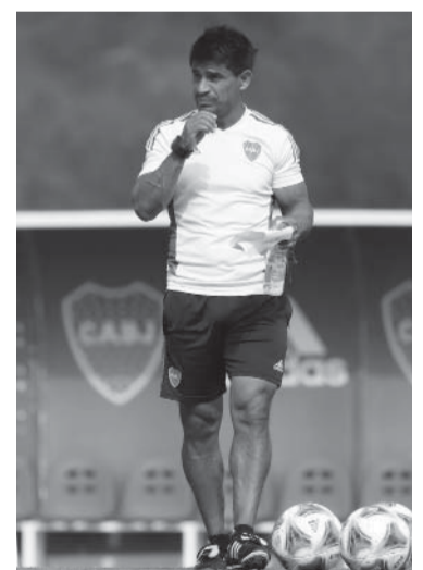
El formoseño, cuestionado.