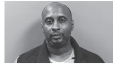
El autor de los disparos.