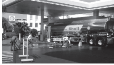
Resta un ajuste en marzo.