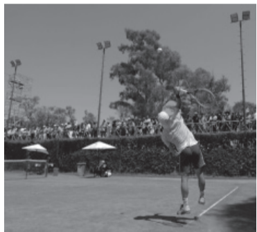
Schwartzman entrena y es un imán para los fanáticos. - Argentina Open -

“Yo soy el que no se siente cómodo a la hora de jugar ahí. Los cordobeses piensan que estoy diciendo que no me gusta Córdoba y yo amo Córdoba, me encanta. El que no se logra adaptar soy yo”. - DIB -