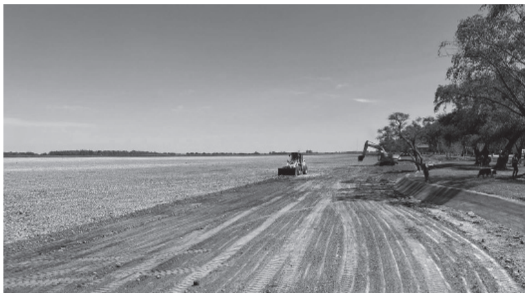
Durante la sequía. Limpieza de la laguna de Navarro. - DIB -

Otro espejo que quedó totalmente seco es la laguna de Sevigne,