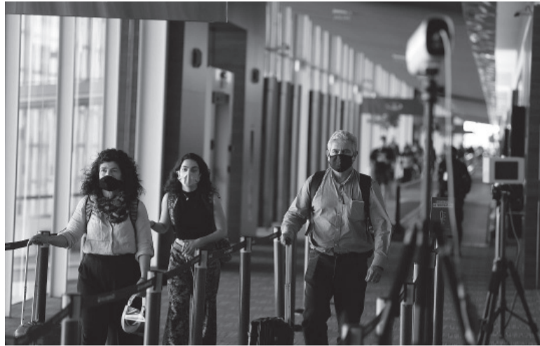
Viajeros. Aeropuerto de Ezeiza. - DIB -

"Otro núcleo es toda la información que nos adelantan los fiscos