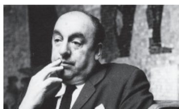
Pablo Neruda. - Archivo -

Ponomarenko a seis años de prisión por difundir "noticias falsas" sobre las acciones del Ejército durante el asedio de la ciudad de Mariupol, en el sur ucraniano. La comunicadora siberiana de 45 años, del portal de noticias RusNews, fue detenida en abril después de criticar el bombardeo ruso al teatro de la ciudad, en una acción que dejó cientos de muertos y que no fue reivindicada por el Kremlin. - Télam -