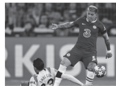
El "Zorzal" fue titular. - Chelsea -

Manchester City derrotó, de visitante, por 3 a 1 a Arsenal y lo alcanzó esta tarde en el liderazgo, al finalizar un partido pendiente de la 12ma. fecha de la Liga Pre-