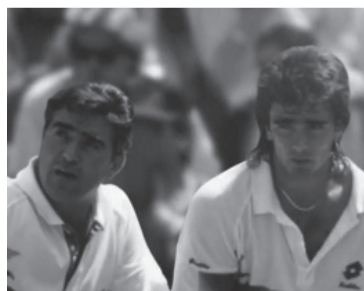
El bahiense, acusado de maltratos contra menores de edad.

En ese sentido, la Cámara Federal de Mar del Plata ordenó avanzar con la investigación de una denuncia por el delito de violación