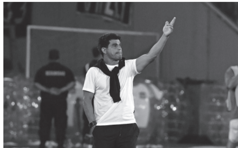
Golpeado. El formoseño analiza variantes para torcer el arranque adverso del último campeón. - CABI -

Ibarra pidió hablar al término de la práctica ante los periodistas presentes, para no hacerlo hoy en rueda de prensa.