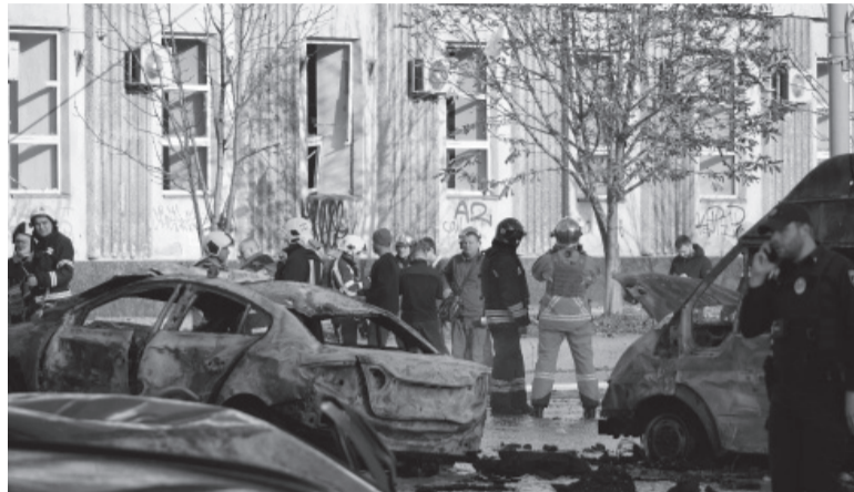
Vida diaria. Ucrania, a días de cumplir un año de invasión.