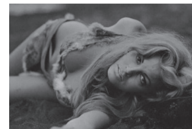
Raquel Welch (1966).