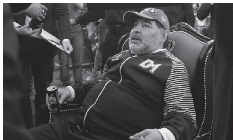
Clave. Se define la causa por la muerte de Diego Armando Maradona.

El letrado fue el que primero solicitó lo que técnicamente se denomina audiencia del artículo 447 del Código Procesal Penal bonaerense, y que se realiza para mejorar en forma oral los argumentos de su apelación, en la que pidió el sobreseimiento de la psiquiatra y, en su defecto, un eventual cambio a