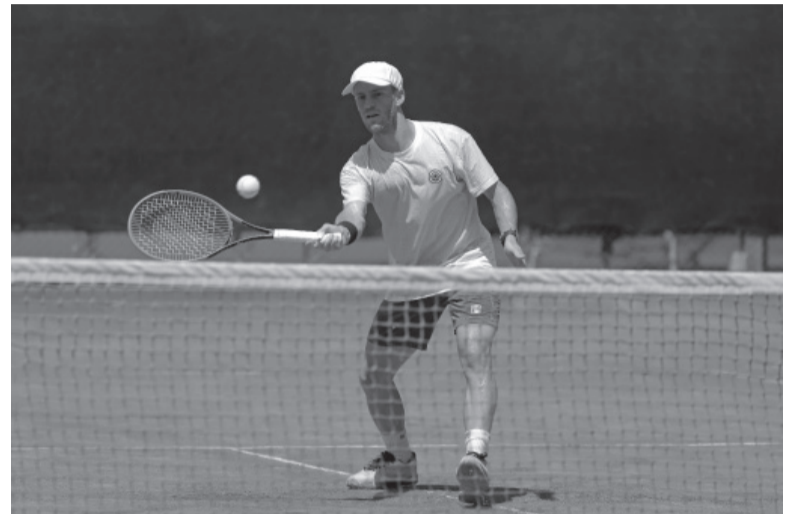
Positivo. Así se lo notó al tenista porteño, más allá del flojo presente. - Argentina Open -