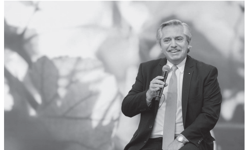
Aparición. El presidente Alberto Fernández.

Por último, destacó que la Argentina "es un país donde los derechos se fueron ampliando sistemáticamente y eso nos hizo una sociedad distinta". Fue en ese momento que destacó a Cristina