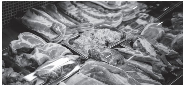
Inflación. El precio de la carne en la mira del Gobierno.

Paralelamente, la Administración Federal de Ingresos Públicos (AFIP) estableció el régimen de reintegros del 10% para consumi-