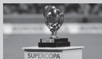
El trofeo se entregará en el "Único" santiagueño.

El partido válido por la Supercopa Argentina, título que deben dirimir Boca -campeón de la última Liga Profesional- y Patronato de Paraná -ganador de la Copa Argentina 2022- se disputará el miércoles 1° de marzo en el estadio Madre de las Ciudades de Santiago del Estero, según confirmaron anoche fuentes de la AFA. La tardía definición no está exenta de polémicas: es que ese tro-