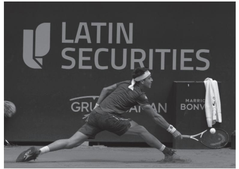
Superado. El argentino luchó pero no pudo con la jerarquía de su rival. - Sergio Llamera - Argentina Open -

De a poco la llovizna aumentaba y el platense cargaba con la presión de cerrar el set. Del otro