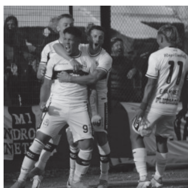
Los de "Chirola", felices.

■ Gimnasia y Esgrima La Plata venció anoche con autoridad a