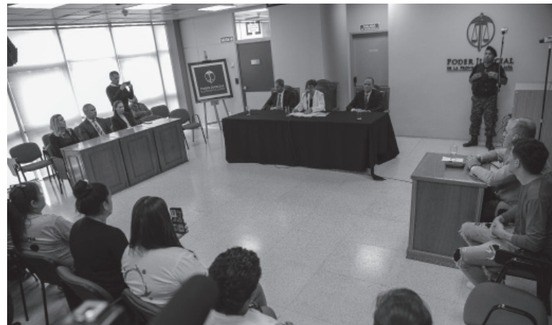
Veredicto. Los jueces iniciaron la lectura donde se dio a conocer el monto de la pena.