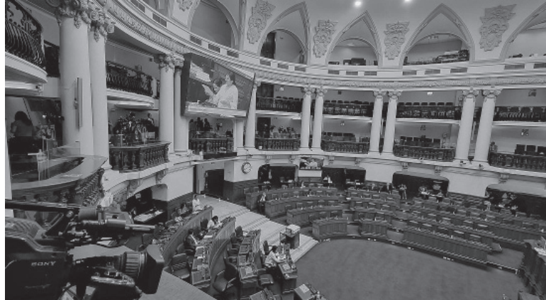
Votación. Fue por 59 a 23, y tres abstenciones.

Ahora el expediente será enviado al Ministerio Público, que podrá formalizar la investigación e iniciar proceso penal contra Pedro Castillo, incluyendo incluso medidas restrictivas. Se trata de la denuncia constitucional que el 11 de octubre pasado presentó la fiscal Benavides, que acusa a Castillo por los presuntos delitos de organización criminal, tráfico de influencias y colusión. A Pedro Castillo se le señala como el presunto cabecilla de una organización criminal que habría operado en tres sectores del Estado: el Ministerio de Vivienda, Construcción y Saneamiento (MVCS), el Ministerio de Transportes y Comunicaciones (MTC), y Petro Perú. En ese sentido, se debatirá la acusación constitucional contra Juan Silva, extitular del Ministerio de Transportes, quien