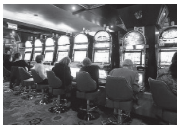
Tratamiento para el juego patológico. - Archivo -

Desde el Observatorio de Adicciones de la Defensoría remarcaron que "ante la proliferación del jue-