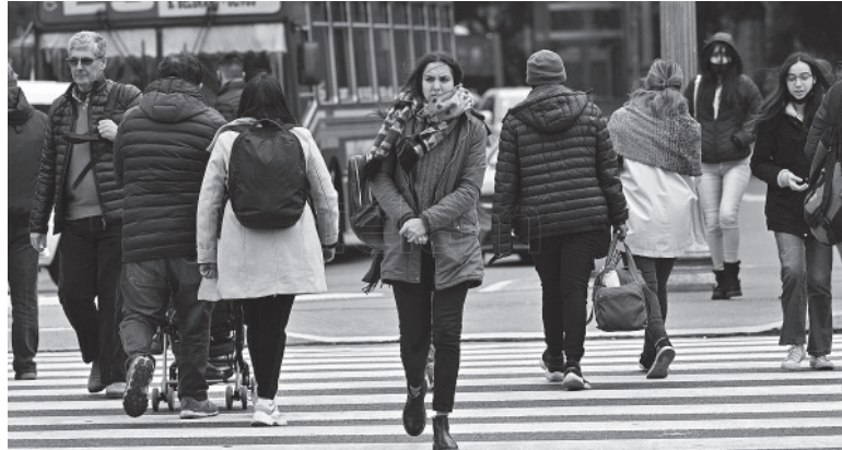
Ola de frío. Gran parte del país con clima propio del invierno. - DIB -

En CABA y La Plata las mínimas se ubican entre 6-9 grados de mínima y los 18-19 grados de máxima,