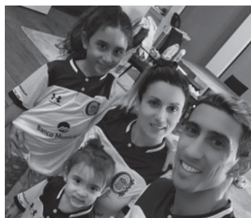
Paños fríos para el regreso del “Fideo”. - Archivo -

este es “el año” para la vuelta de Di María a Central pero los dirigentes no hablaron con el protagonista, quien continuó: “Si yo ahora no vuelvo, me putean a mí. El que decide de mi futuro soy yo y las decisiones siempre fueron impecables, por algo estuve en los mejores clubes. La decisión de volver la voy a tomar yo”. - Télam -