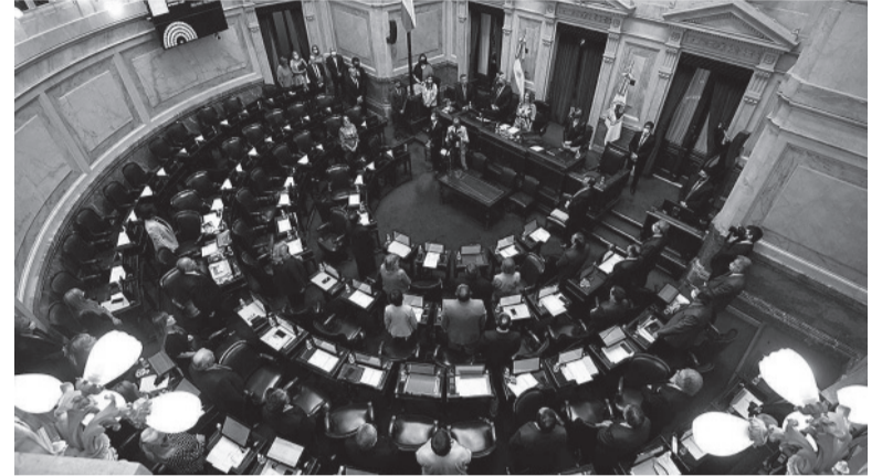
Cámara alta. Tendrá menos representación kirchnerista.

desde donde se priorice la posibilidad de aportar a la reflexión sobre la Argentina que queremos para nosotros y las futuras generaciones, sin grietas, con discusiones que planteen soluciones a corto, mediano y largo plazo”, aseguraron en el comunicado en que confirmaron la noticia.