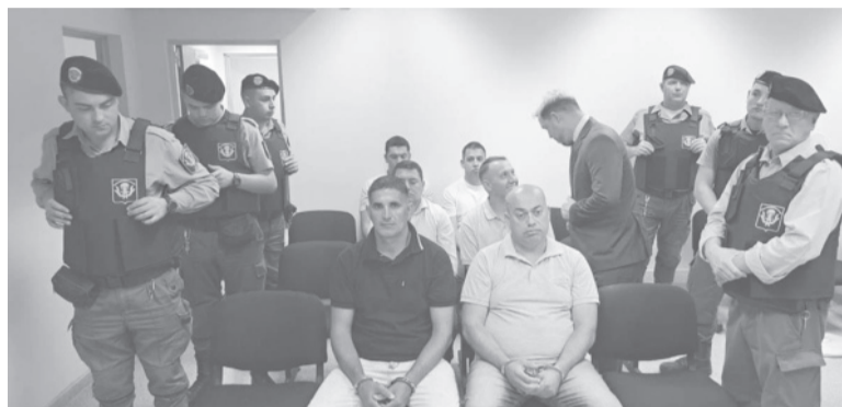
Pedido. El viernes 24 continuará el alegato.