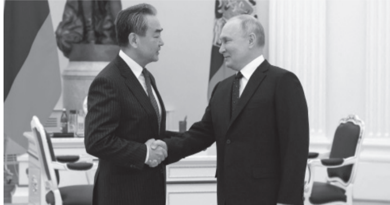
Aliados. Vladimir Putin se entrevistó ayer con el jefe de la diplomacia china, Wang Yi.

Por su parte, durante un concierto patriótico en el estadio Luzhnikí de Moscú, Putin defendió la invasión rusa. "Hoy, la jerarquía (militar) me ha dicho que se está luchando en nuestras tierras históricas por nuestro pueblo", dijo Putin ante decenas de miles de asistentes y un día después de dar