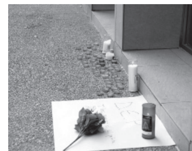
Conmoción en el municipio de Sallent. - El Periódico -