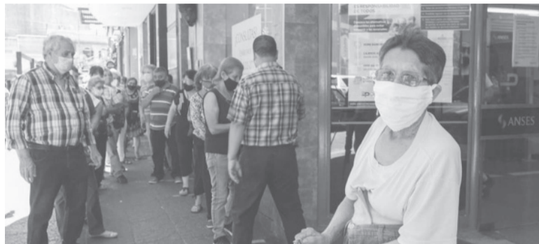
Anuncio. Incremento de 17,04%.

El mismo irá decreciendo de forma progresiva hasta los $5.000