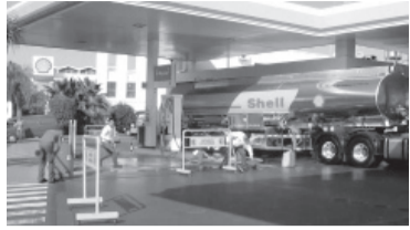
Estación de servicio Shell.