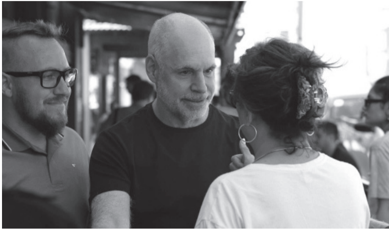
Con vecinos en un paseo por el Conurbano.

Publicó una foto del kilómetro cero en redes sociales.