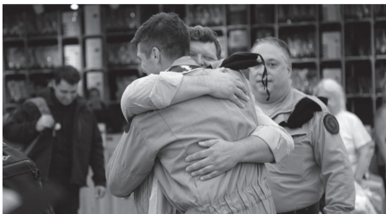
Recepción. La brigada regresó luego de que Turquía concluyera el domingo las operaciones de rescate.

La brigada USAR (Urban Search and Rescue - Búsqueda y Rescate Urbano), que fue enviada desde Argentina a Turquía el 9 de este mes,