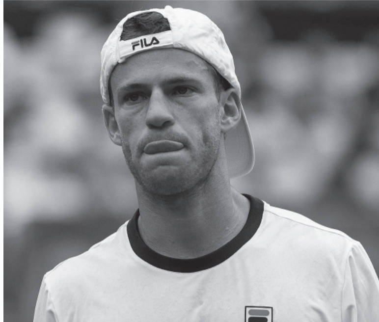
Derrota. El talentoso porteño, uno de los mejores del circuito, volverá a caer en el ranking tras la pérdida de puntos.

En tanto el platense Tomás Martín Etcheverry (75), completó su match inconcluso por lluvia con