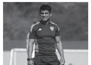
El DT, más tranquilo.