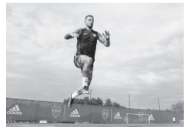
Payero iría desde el arranque.

Sin duda que la salida de Varela es la más significativa: el entrenador había expresado en la rueda de prensa tras el triunfo ante el "calamar" que "a Varela lo saqué en los primeros minutos del segundo