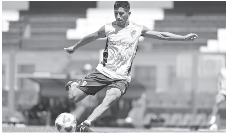
Aliendro, posible titular. - CARP -

Antes de regresar a Buenos Aires, el equipo de Demichelis trabajó en el estadio de Talleres.