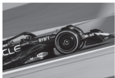
Verstappen, de Red Bull.

■ F1.- El piloto neerlandés Max Verstappen, a bordo de un Red Bull, fue el más rápido en la sesión de ensayos con miras al inicio oficial de la temporada de Fórmula 1, que será en el Circuito Internacional de Bahrein el domingo 5 de marzo. Verstappen, bicampeón del mundo empezó, comenzó la nueva temporada como había terminado la anterior, en lo más alto, y fue más rápido que el español Carlos Sainz Jr, segundo con Ferrari, y el tailandés Alex Albon, tercero con Williams, según detalló la agencia