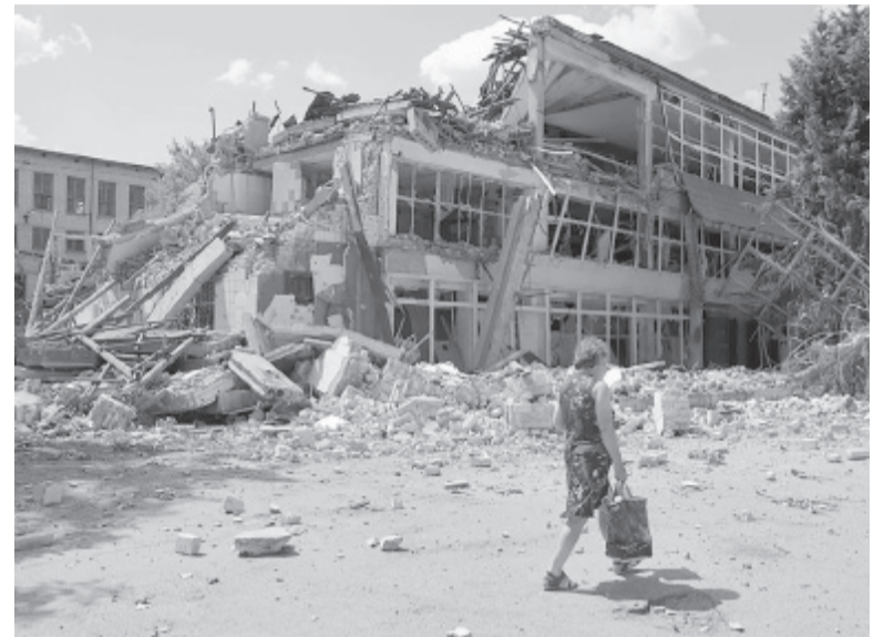
Vida cotidiana. Una postal de Lysychansk, en la región de Lugansk.

La ocupación rusa de la central nuclear de Zaporizhzhia, la más grande de Europa, elevó el temor a que haya una catástrofe atómica por un error humano o por los bombardeos, de los que Moscú y Kiev se acusan mutuamente. Esa amenaza nuclear resurgió esta semana ante el anuncio de Vladimir Putin de