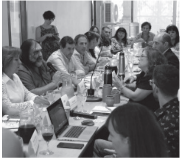
El encuentro se realizó en La Plata.