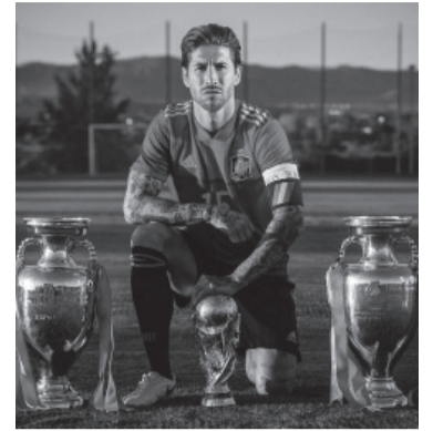
El central del PSG fue campeón del mundo.