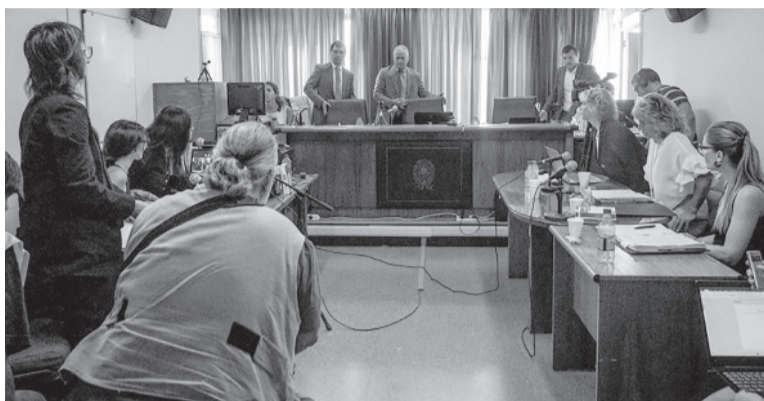
Alegato. El segundo juicio entró en su tramo final en la ciudad de Mar del Plata.