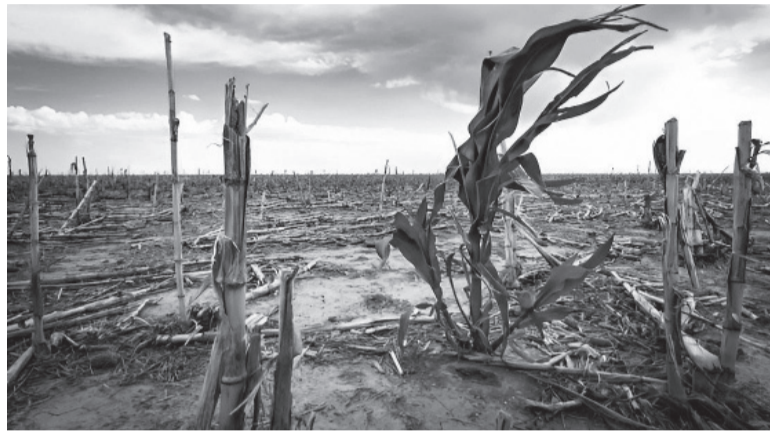
El trigo, una de los cultivos más afectados.

Según el reporte, el principal motivo de la caída de las exportaciones en enero fue el comportamiento del agro, afectado severamente por las sequías y heladas en curso. La caída total de las exportaciones sería mayor aún si no fuera por el comportamiento del sector automotriz y energético, para los cuales Abeceb espera un incremento en sus exportaciones con relación a 2022. En relación con las importaciones, la consultora señaló que la magnitud de su retracción dependerá principal-