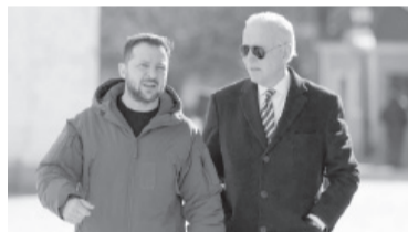
Biden, días atrás, en Kiev junto a Zelenski.

El 24 de febrero de 2022, el presidente ruso Vladimir Putin anunció una "operación militar especial", nombre con el que el Kremlin designa a la invasión a gran escala, bajo el argumento de "desmilitarizar y desnazificar" al país para ayudar a los separatistas prorrusos del este. Pese a la amenaza de una "respuesta inmediata" para todos los gobiernos que intervengan, las potencias nucleadas en la OTAN calificaron la guerra de "injustificada y no provocada",