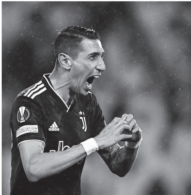
Golazo. Con un disparo colocado desde el vértice derecho del área, el rosarino festeja su primer gol. - JFC -

En un partido emocionante, Manchester United, donde el argentino campeón mundial Lisandro Martínez fue titular, eliminó a Barcelona al vencerlo por 2 a 1 y