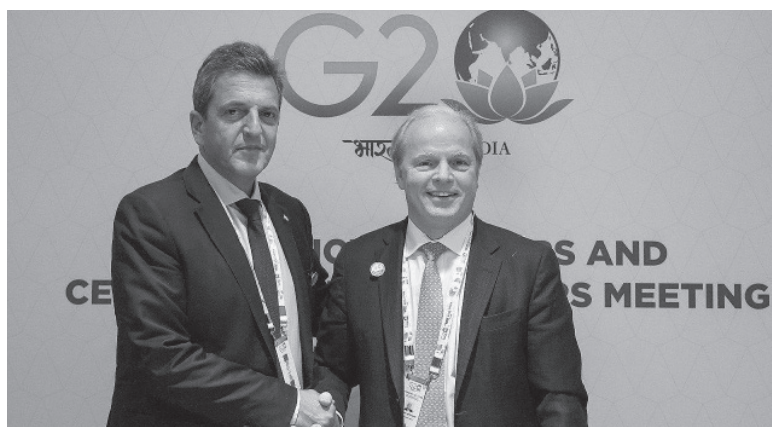
Encuentro. Sergio Massa con Axel van Trotsenburg (Banco Mundial), en India.

Trotsenburg también se comprometió a elevar al directorio créditos