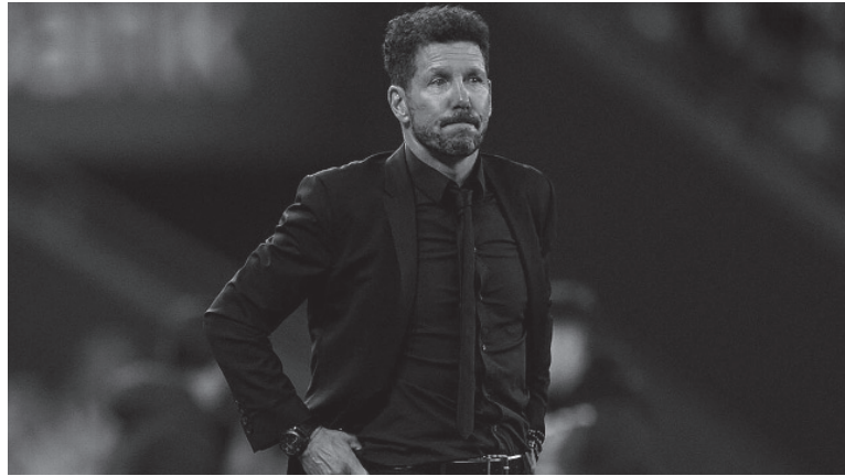
Apuntado. El exmediocampista vive su momento más difícil como entrenador del "Colchonero".

Betis, luego de estar dos goles abajo, revirtió hoy el resultado ante