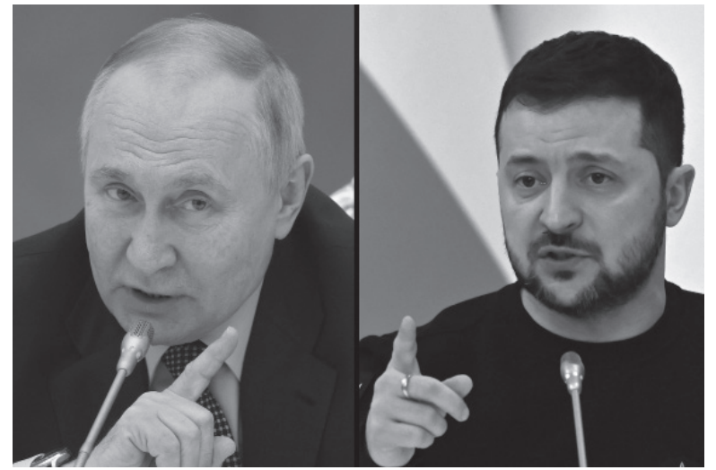
Discursos. El presidente ruso Vladimir Putin y el presidente ucraniano, Volodimir Zelenski.

“En las propuestas y los puntos presentados por China, lo primero de todo, China no tiene mucha cre-