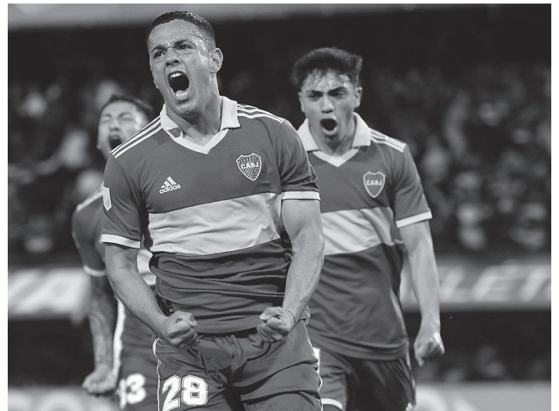
Antecedente. El "Xeneize" encaminó su último título en octubre pasado, tras vencer 1-0 al "Fortín".

En cuanto a Vélez, existe disconformidad con el rendimiento del equipo que dirige el uruguayo