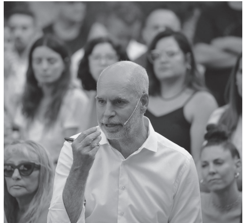
Lanzamiento. El mandatario juega en la interna PRO.

Manes ganaron, pero ahora las encuestas muestran que el actual gobernador Axel Kicillof está por encima. ¿Es necesario ampliar la base con libertarios?