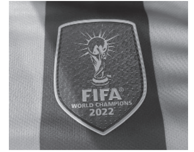
Argentina llevará el distintivo. - ADIDAS -