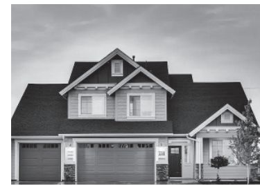
Búsqueda de efectividad en inmuebles.

Hay criterios que permiten orientar el capital. La coyuntura política y económica son otros aspectos a considerar.