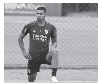
La rodilla derecha tiene a maltraer al defensor.

Desde la llegada de Demichelis, las lesiones fueron un problema para el entrenador ya que Matías Kranevitter sufrió una fractura en el peroné derecho y la lesión ligamentaria en ese mismo tobillo en el primer amistoso de pretemporada ante La Calera