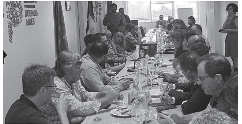
Pausa. La reunión de paritarias.

Y sostuvieron que "estamos de acuerdo con un cuarto intermedio para que el Gobierno haga un mayor esfuerzo y logre una propuesta