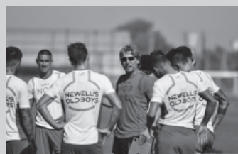
El "Gringo", dolido. - NOB -

"Vi las imágenes del partido con Claypole. Los chicos hicieron un buen partido, se intentó de las maneras que habíamos