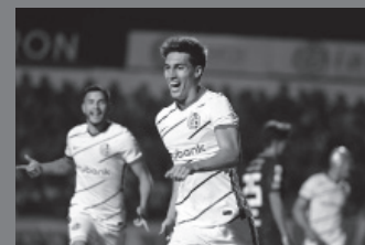
El central fue vendido al Sevilla.