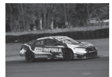
Llaver, el más veloz. - TC2000 -

Hoy habrá tres sesiones de entrenamientos entre las 9.20 y 14.25, mientras que las pruebas de clasificación se desarrollarán de 16.25 a 16.45. Mañana, en tanto, se disputarán dos carreras: la primera se largará a las 11.35 y comprenderá 20 minutos más una vuelta; mientras que la segunda y última se iniciará a las 12.55, con 25 minutos más una vuelta. - Télam -