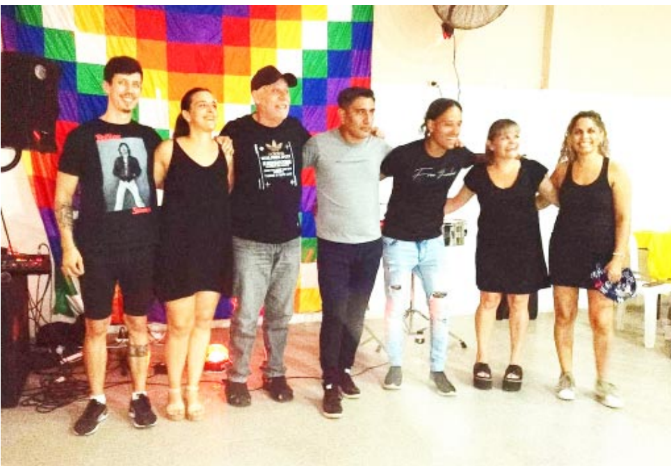
Los artistas sobre el final del evento.

-Concurrida adhesión a convocatoria del barrio Las Violetas