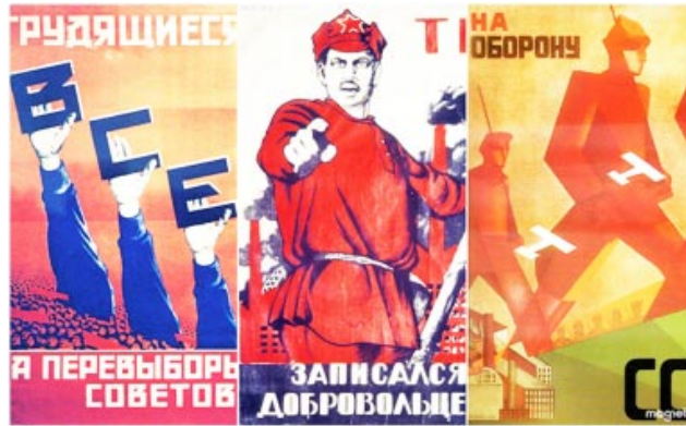
Cartelera vista en Rusia, donde se la ve ingeniosa, pero las campañas no existen...

De este tema hemos escrito otras veces. Si lo hacemos de nuevo es para lamentar que las personas que se equivocan sean calificadas como "malvivientes", que es