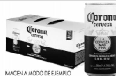
IMAGEN A MODO DE EJEMPLO

Cerveza en lata x 269 cc./ Pack x 10 latas de 269 cc. c/u "Corona" *3.000