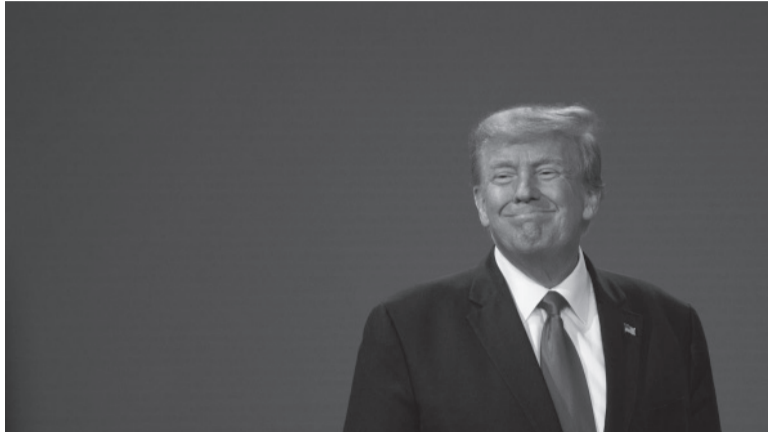
Cargos. Por pagar para no revelar un vínculo.

La cadena CNN, citando fuentes no identificadas, dijo que Trump podría enfrentar 34 cargos relacionados con la falsificación de