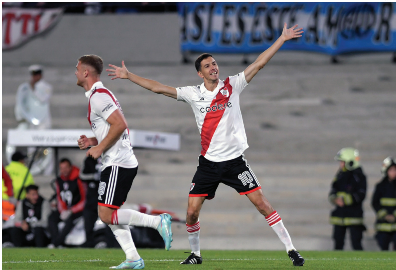
- Télam -