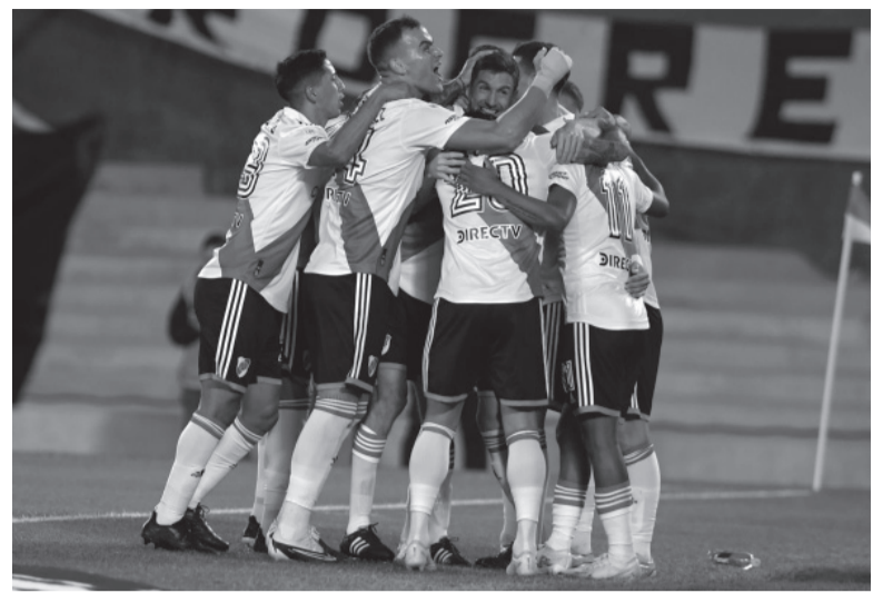
Implacable. Dominio total del "Millonario" sobre el "Tatengue".

acomodó el pie, usó el impulso de la fuerza del centro de Paradela y la clavó arriba. Golazo.