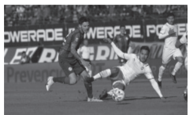
El "Rojo" le gana 74-68 al "Ciclón" en el historial.

Árbitro: Yael Falcón Pérez. Cancha: Claudio Tapia. Hora: 15.30 [ESPN Premium].