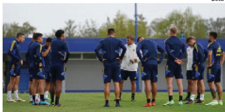
- Boca -

El "Xeneize" se presenta con DT interino, tras la despedida de Ibarra y el no de Martino. San Lorenzo, prendido en la lucha de arriba, recibe a un Independiente urgido de victorias. En Avellaneda, Racing buscará consolidar su buen momento ante el duro Huracán. - Pág. 8 -