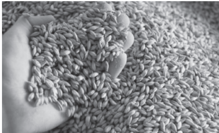
Siembra. Trigo y cebada con buenas expectativas.

La nueva medida se pondrá en marcha en un contexto de una fuerte caída productiva en el agro como consecuencia de la sequía, cuya mayor intensidad se dio entre