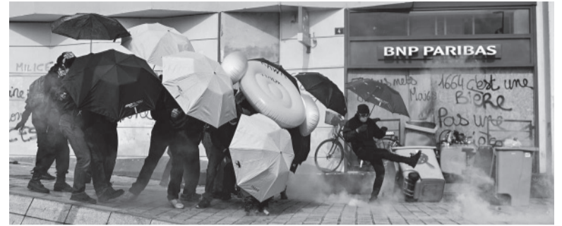
Manifestaciones en París.

Son por detenciones arbitrarias tras la reforma jubilatoria