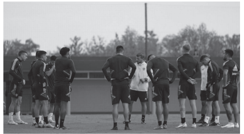
Parche. Herrón dirige hoy, a la espera del nuevo entrenador. - Boca -

Árbitro: Leandro Rey Hilfer. Cancha: Pedro Bidegain. Hora: 19.00 [TNT Sports].