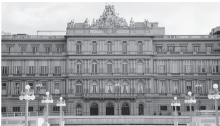
Pobreza. Los datos reflejan una situación preocupante.