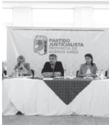
Máximo Kirchner preside la reunión del Consejo del PJ.

El presidente del PJ bonaerense, Máximo Kirchner, convocó a una marcha de respaldo a la vicepresidenta Cristina Fernández de Kirchner para el próximo 13 de abril ante la Corte Suprema, al tiempo que reimpulsó un reclamo que el gobierno nacional: que se otorgue un aumento salarial de suma fija y se suma el salario mínimo. Esas fueron las principales conclusiones de una reunión del Consejo Provincial del PJ, que debatió el La Plata presidido por Kirchner, con la presencia de una treintena de consejeros que acoraron "poner al partido en modo electoral", como dijo Omar Plaini, el legislador y sindicalista representante de los canillitas. El ministro de Desarrollo de la Comunidad provincial, Andrés "Cuervo" Larroque. El ministro insistió en que el Alberto Fernández quien tiene que definir qué hacer, al señalar que en el cónclave se habló "de la necesidad de definir un marco (electoral) nacional. Somos una fuerza nacional y necesitamos definiciones en ese sentido, claridad para poder avanzar en el diseño general". - DIB -