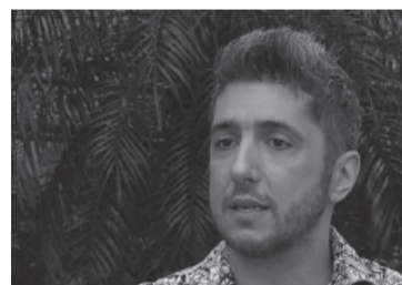
El conductor televisivo acusado de violación. - DIB -

La Fiscalía Criminal y Correccional 10 labró actuaciones "por muerte dudosa" y dispuso la Unidad Criminalística Móvil y al gabinete de psicólogos para asistir a los padres de la beba. - DIB -