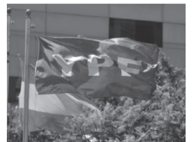
La compañía fue eximida de responsabilidades, pero el país no.

la empresa debería haber hecho una oferta pública de adquisición (OPA) al resto de los accionistas, según los estatutos de YPF y el prospecto de oferta pública que la compañía presentó ante la Comisión de Valores de Estados Unidos (SEC, por sus siglas en inglés), en 1993. A YPF, en tanto, la acusaban de no haber obligado al Estado argentino, como nuevo accionista, de hacer cumplir su estatuto. Los distintos abogados del Estado argentino intentaron convencer a la jueza de que el derecho de expropiación está por encima de cualquier estatuto empresarial, pero no lograron sostener la defensa. Para la petrolera, sin embargo, fue una victoria, ya que fue eximida de responsabilidades. "La República [Argentina] prometió a los tenedores de valores que les proporcionaría una salida compensada si recuperaba el control sobre el número requerido de acciones. Los demandantes tienen derecho a una sentencia sumaria contra la República por sus reclamaciones por incumplimiento de contrato. Los demandantes han demostrado la existencia de un con-