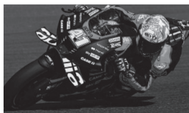
La Aprilia dominó los ensayos en Termas de Río Hondo.

El italiano Luca Marini (Ducati) logró el cuarto registro, mientras que el francés Jo-