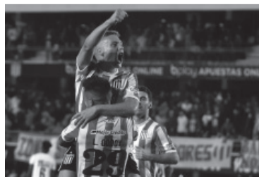
Necesario triunfo del "Pincha" ante su gente.

Estudiantes se repuso anoche de la derrota sufrida en el clásico ante Gimnasia (1-2) durante la jornada anterior y derrotó claramente a Newell's por 3-0, en la continui-