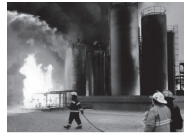
Imagen impactante del fuego.