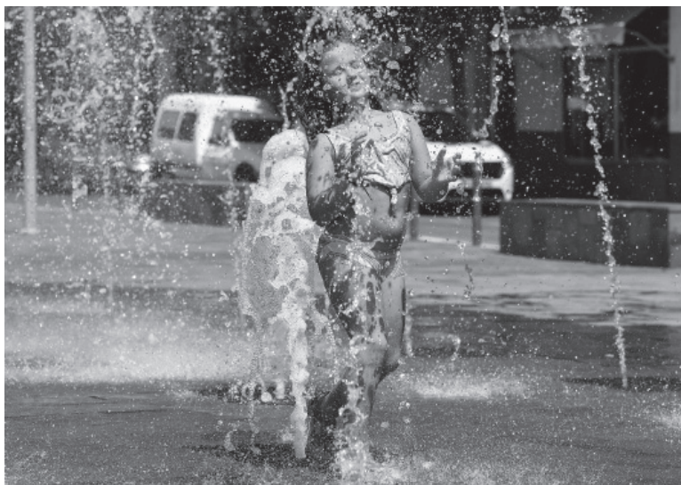
Alerta. La ola de calor no da respiro.

El nivel rojo es el alerta máximo dispuesto por el organismo meteorológico e indica que las temperaturas tienen un "efecto alto a extremo en la salud" y pueden ser "muy peligrosas y afectar a todas las personas, incluso a las saludables", por lo que se recomienda aumentar el consumo de agua y no