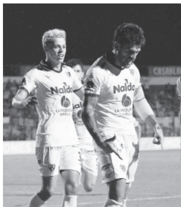
Gran triunfo para los de Damonte.

Sarmiento superó a Rosario Central por 4-1 como local, en el