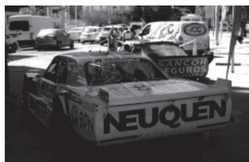
Movimiento en el Centenario. - ACTC -

El circuito, ubicado a 15 kilómetros de la capital provincial, tiene 4.380 metros de cuerda. Fue