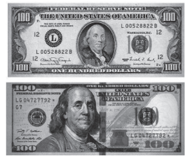
Los dos tipos de dólar.