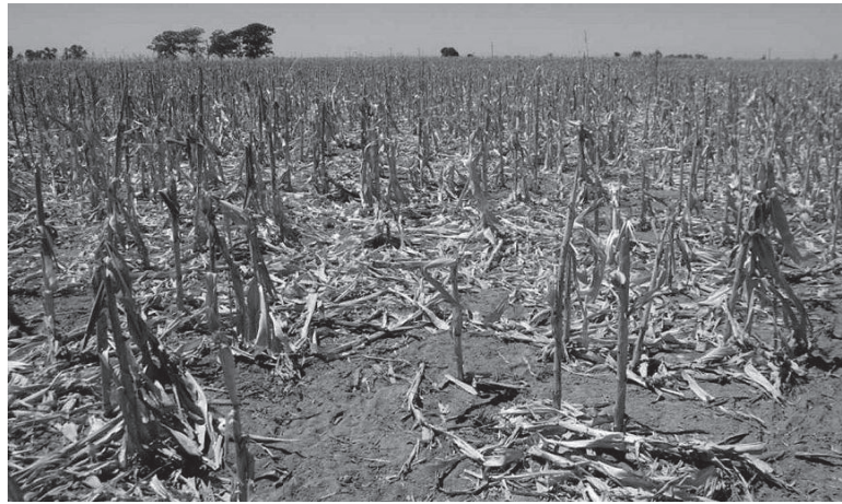
No afloja. La falta de agua sigue golpeando al campo.

A partir de la situación climática adversa, CREA proyecta hasta el momento una cosecha total de soja de 31,2 millones de toneladas, un 38% menos que en la campaña