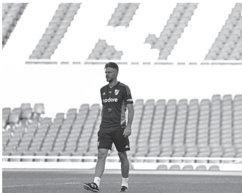
Partido clave. Al margen de la última derrota, Demichelis sabe que es el momento de consolidar un equipo. - CARP -

Árbitro: Darío Ceballos. Cancha: Néstor Díaz Pérez. Hora: 19.15 (ESPN Premium).