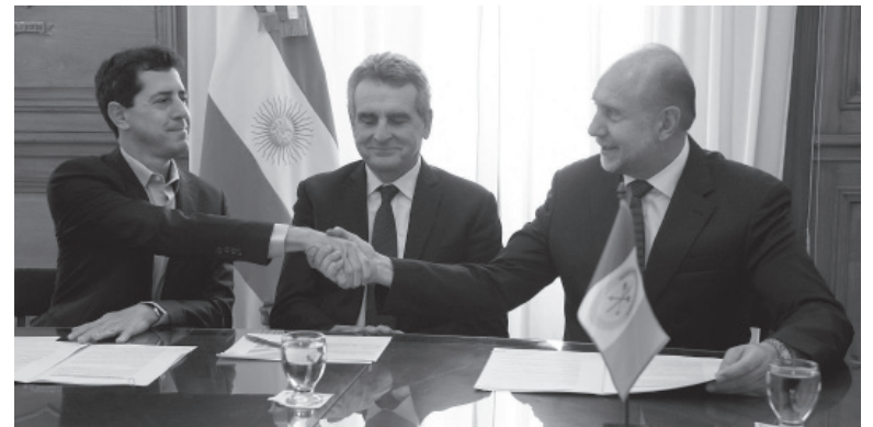
Señal. De Pedro le da la mano a Perotti en la Casa Rosada.

Se trató de un gesto de contención política luego de las críticas del mandatario santafesino al accionar de la Nación en materia de Seguridad, sobre todo al ministro del área, Aníbal Fernández, quien había dicho ayer que la guerra con el narco “se perdió”. Perotti fue muy