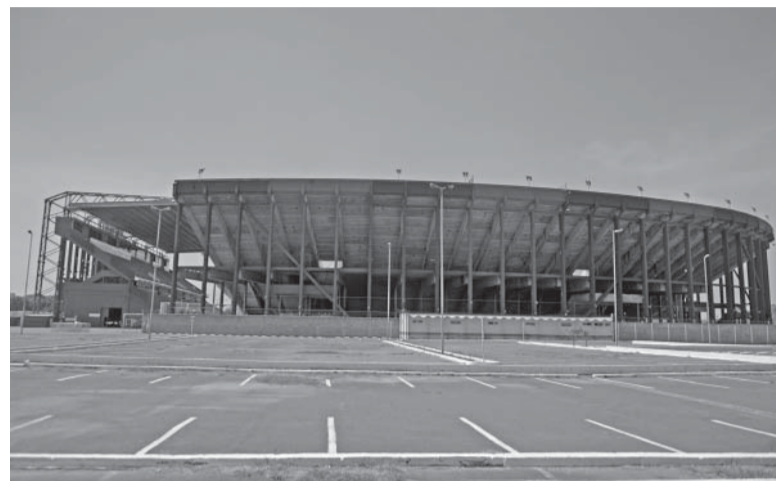
Renovado. Los hinchas que se acerquen al "Nuevo Gasómetro" lo encontrarán recientemente pintado en interiores y exteriores.

Árbitro: Fernando Rapallini. Cancha: Norberto "Tito" Tomaghelto. Hora: 19.15 (ESPN Premium).