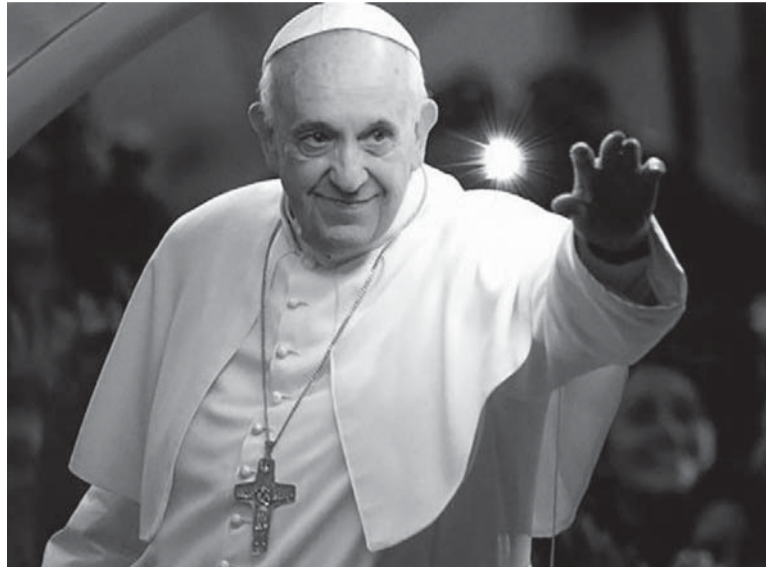
Deseo. El Santo Padre aclaró que el viaje a Argentina dependerá de "miles de factores". - DIB -

Ante ese dato, el Papa fue consultado sobre si podría definir su viaje después de una elección, como la que se realizará este año en la Argentina, y respondió: "Podría pasar. Después de una elección ciertamente que sí. Por eso en tiempo electoral no se hacen viajes en los países para evitar que la presencia sea usada por el partido gobernante para una reelección o algo por el estilo".