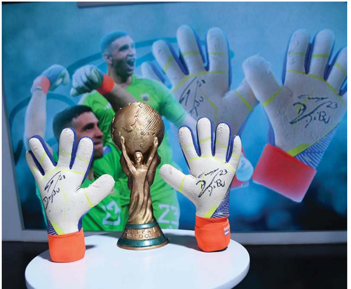
- Télam -

La convocatoria coincide con el día en que se conmemoran los 50 años de la victoria de Héctor Cámpora. El encuentro reunirá a agrupaciones políticas, sociales y sindicales kirchneristas. La vicepresidenta disertó ayer en Viedma. - Pág. 3 -