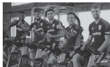
Buen semblante en el entrenamiento de ayer.

co Armani, Robert Rojas, Leandro González Pírez, Enzo Díaz y Milton Casco; José Paradelo, Enzo Pérez, Nicolás de la Cruz y Nacho Fernández; Beltrán y Rondón o Borja o Barco.