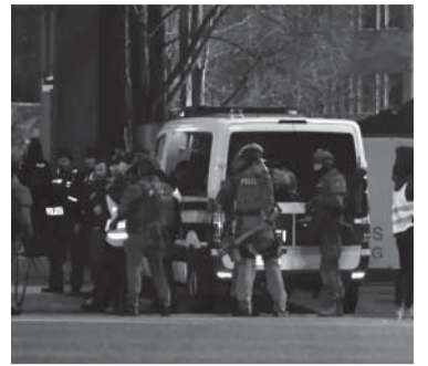
Ataque en Hamburgo.

ALEMANIA.- La policía continúa la investigación del tiroteo registrado la noche del jueves en un centro de los testigos de Jehová en Hamburgo, que causó ocho muertos entre ellos el atacante, quien se quitó la vida al llegar la policía. Según informaron las autoridades en una conferencia de prensa, el agresor usó para la matanza una pistola para la que disponía de permiso de armas, informó la agencia EFE. "El perpetrador huyó a la primera planta del edificio y allí se suicidó, por lo que hablamos en total de ocho muertos", dijo el concejal de Interior de Hamburgo, Andy Grote. - DIB -