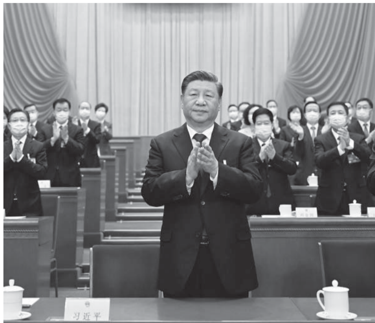
Reelegido. Xi Jinping, el dirigente con más años en el poder en la historia reciente del gigante asiático.

ciales, Pekín dio un brusco giro de timón después y retiró la polémica estrategia, no obstante haber resultado de enorme eficiencia sanitaria para contener los contagios. Desde enero, cuando las infecciones disminuyeron, el país muestra índices de recuperación de la actividad.