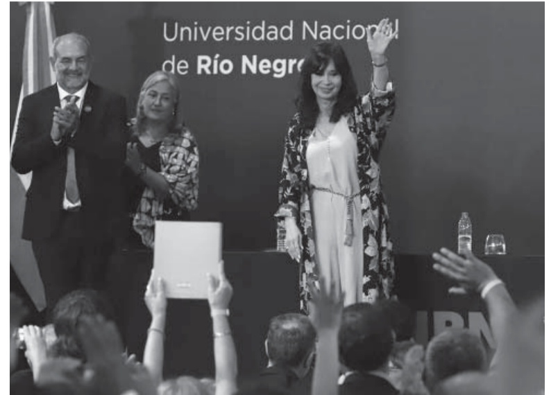
Aclamada. La vicepresidenta disertó en la Universidad de Río Negro. - Télam -

En cuanto a la agencia de noticias del Estado, dijo: “Hay que ver cómo funciona Télam, qué función cumple, poner alguien que lo estudie, ver hasta qué punto es importante que haya una agencia de noticias del Estado, ver cómo se hace en otros países del mundo”. - Télam -