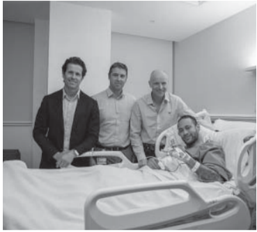
Neymar, operado.