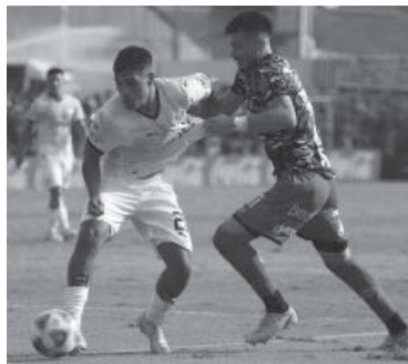
El DT "Rojo", en la cuerda floja.