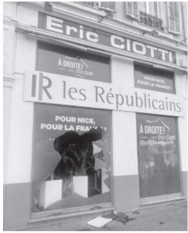
El local partidario vandalizado.