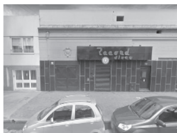
El frente del boliche Record Disco.

La causa quedó caratulada como "Averiguación de causales de muerte" y a la espera de que los peritos recaben más información