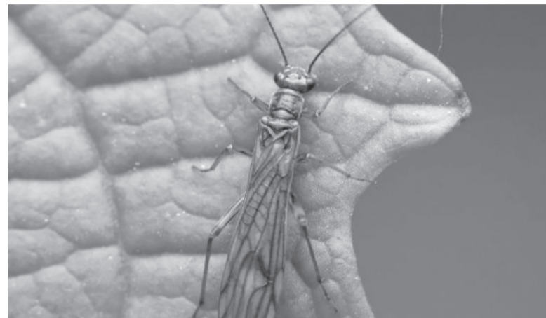
Los pequeños insectos que se alimentan de numerosas especies vegetales.

Existen distintas estrategias para controlar a los trips. Una es la eliminación de las malezas, ya que pueden hospedar al insecto. Otra es el monitoreo permanente para detectar a la plaga y poder tomar las medidas pertinentes. Además, existen ácaros e insectos depredadores como el Amblyseius cucumeris , amblyseius swirskii y