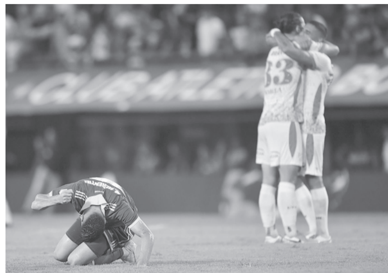
Golpazo. El Boca de Ibarra cortó racha de 14 partidos invicto como local.

discreto e Instituto con poco se fue en ganancia por 2 a 1 ante un rival que fue de menor a mayor. Los visitantes tuvieron la virtud de ser efectivos en las dos jugadas de peligro que crearon e inteligentes para saber aguantar en el medio y atrás.