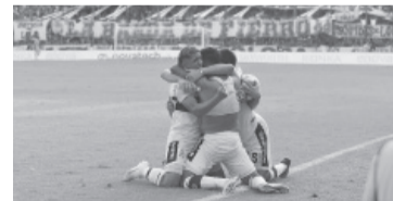
Gimnasia se sacó la mufa.