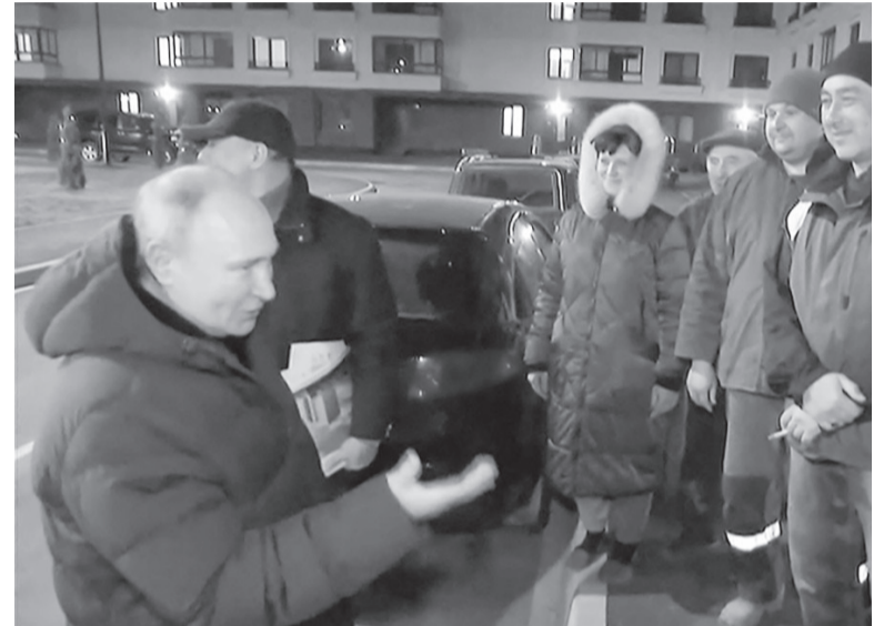
En foco. Putin caminando por las calles de Mariupol.

El mandatario llegó a Mariupol en helicóptero desde Crimea e hizo