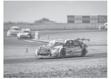
El Honda Civic 83 de Arduso. - TC 2000 -