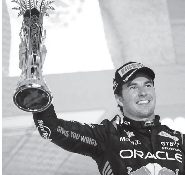
Uno más. El mexicano Pérez obtuvo su quinto triunfo en la categoría. - Instagram: @schecoperez -

El récord de vuelta al circuito de 6.174 metros de extensión lo consiguió en el último giro el campeón Verstappen, con 1:31,906 minutos. La unidad adicional le permite al neerlandés