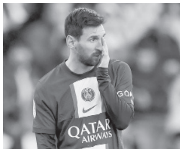
Lionel Messi.