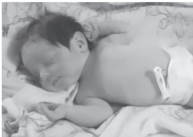
Redes. La difusión de la foto de la beba ayudó a su hallazgo.

da el sábado último del mencionado hospital de Isidro Casanova. Luego de siete horas y gracias a la publicación de su foto en redes sociales y medios de comunicación, fue localizada en la parroquia San José de la misma localidad.