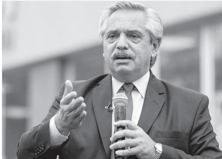
A cargo. Alberto Fernández encabezará la ceremonia inaugural, hoy a las 18 en el CCK.