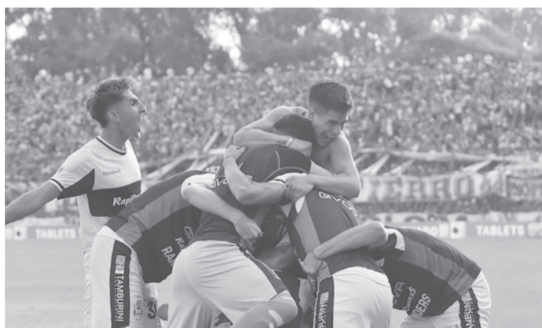
Locura "tripera".