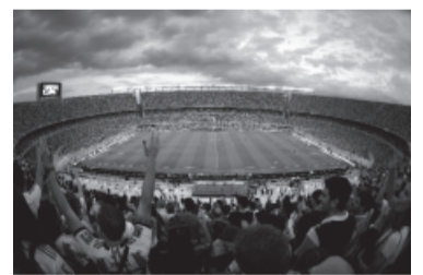
El renovado estadio de River lució desbordado.

Allí personal de la División de Contravenciones y Faltas en Eventos Masivos de la Policía de la Ciudad requisó 52 entradas falsificadas y celulares de un grupo de personas que adujo pertenecer a una empresa de turismo de la provincia de La Pampa.