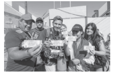
En Chaco hay furor por la visita de Boca.

Sobre las dos derrotas consecutivas, ante Banfield e Instituto: