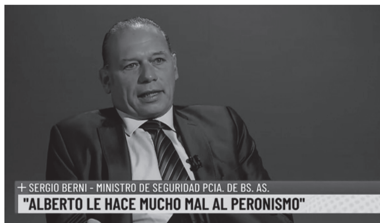
+ SERGIO BERNI - MINISTRO DE SEGURIDAD PCIA. DE BS. AS.

Berni insistió con que considera “imposible” la reelección de Alberto Fernández aunque advirtió que “personajes” como Patricia Bullrich y Ricardo López Murphy “eran muertos políticos hace 15 años y hoy lideran encuestas”. La pregunta, entonces, fue si el Presidente en esta crisis política y económica entra en esa categoría de “muerto político”. Berni lo negó: “Él no es un muerto político porque los muertos no molestan. El Presidente molesta políticamente en la reconstrucción de un peronismo que tiene ambición de poder para transformar de verdad”. Y remarcó: “Le hace mucho mal al peronismo, molesta esa necedad de seguir diciendo que va a ser candidato a presidente y mientras tanto el peronismo no puede reorganizarse”. - DIB -