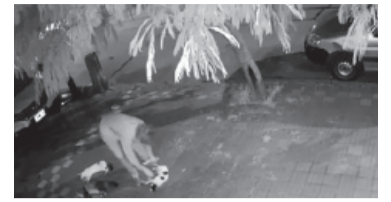
Imagen captada del “matagatos”.