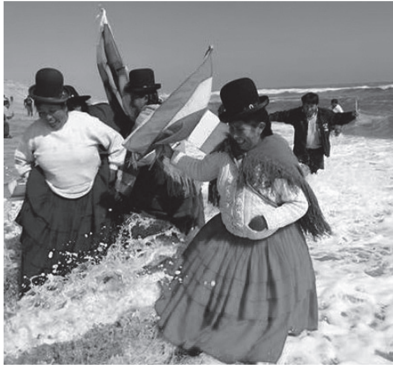
Reclamo. El país andino y su pedido soberano.

Arce -que subió parte de su discurso a su cuenta de la red Twitter- declaró la predisposi-