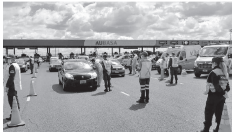
Operativo. Los controles y fiscalizaciones desplegarán en total 150 agentes.