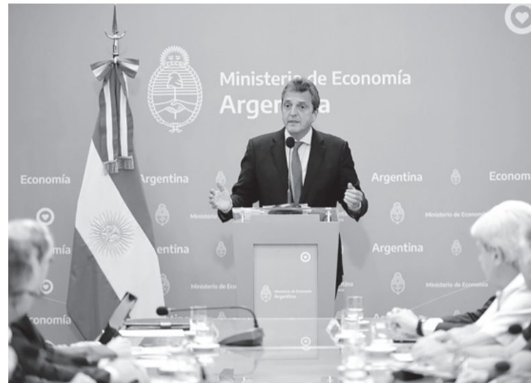
Anuncio. El ministro de Economía, Sergio Massa. - Archivo -

Con lo recibido por sus operaciones de venta de estos títulos, los organismos deberán canjear el 70%