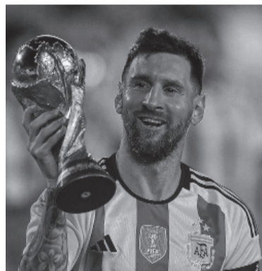
La alegría del capitán.