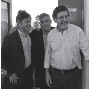
El funcionario junto a Kicillof. - DIB -