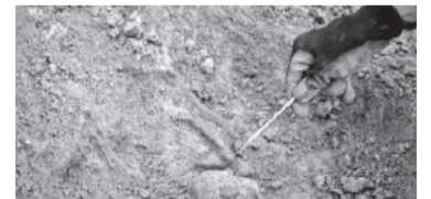
Restos de un armadillo terrestre gigante. - La Capital -

La forma más común es la tuberculosis pulmonar, aunque puede atacar a otros órganos. Estas formas de tuberculosis, llamadas extrapulmonares, son más graves y pueden producir artritis, meningitis, osteomielitis, etc. - DIB -