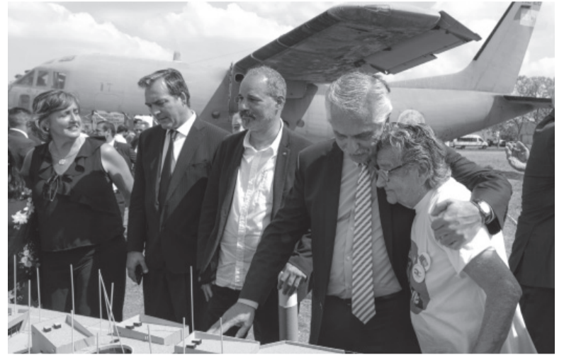
Acto. Ayer en Campo de Mayo.

Después Fernández dedicó un extenso párrafo de su discurso para