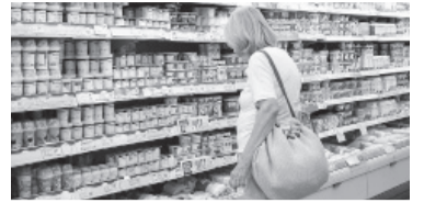
Las góndolas de los supermercados vendieron más.