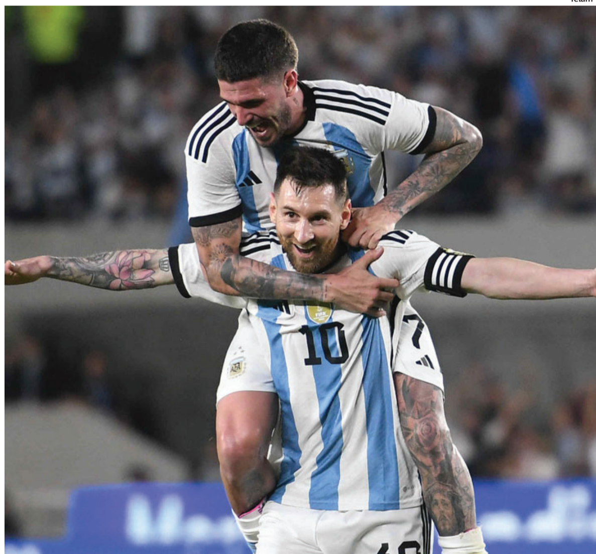
- Télam -