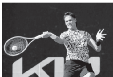
Caída del rosarino ante Lehecka. - AAT -

El argentino no pudo controlar la potencia y eficacia de Lehecka, quien se quedó con claridad con el match con un sólo quiebre por