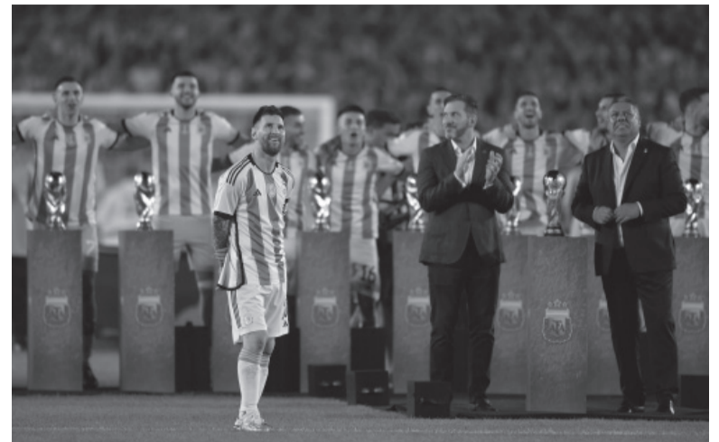
Inolvidable. En el epílogo, cada jugador recibió una réplica del trofeo mientras Messi y Scaloni hablaron a los hinchas.

Tras estrellar dos tiros libres en los palos, Messi logró anoche en su último intento convertir el gol 800 en su carrera, el 99 con la camiseta de la Selección. El martes, ante Curazao en Santiago del Estero, podría alcanzar las tres cifras. "Gracias a ustedes por el cariño que recibimos, no sólo desde que somos campeones del mundo, sino desde antes", dijo Messi cuando le dieron un micrófono en